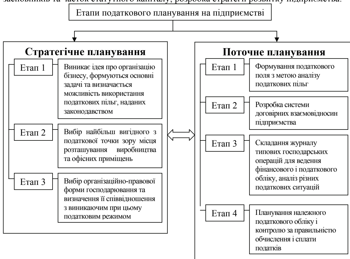
Рисунок 3 – Етапи податкового планування на підприємстві

Стратегічне планування здійснюється, як правило, засновниками підприємства та включає такі об'єкти планування як: вибір основних напрямків діяльності та формування пакету документів, необхідних для державної реєстрації; вибір місця реєстрації; вибір організаційно-правової форми господарювання; визначення складу засновників та часток статутного капіталу; розробка стратегії розвитку підприємства.