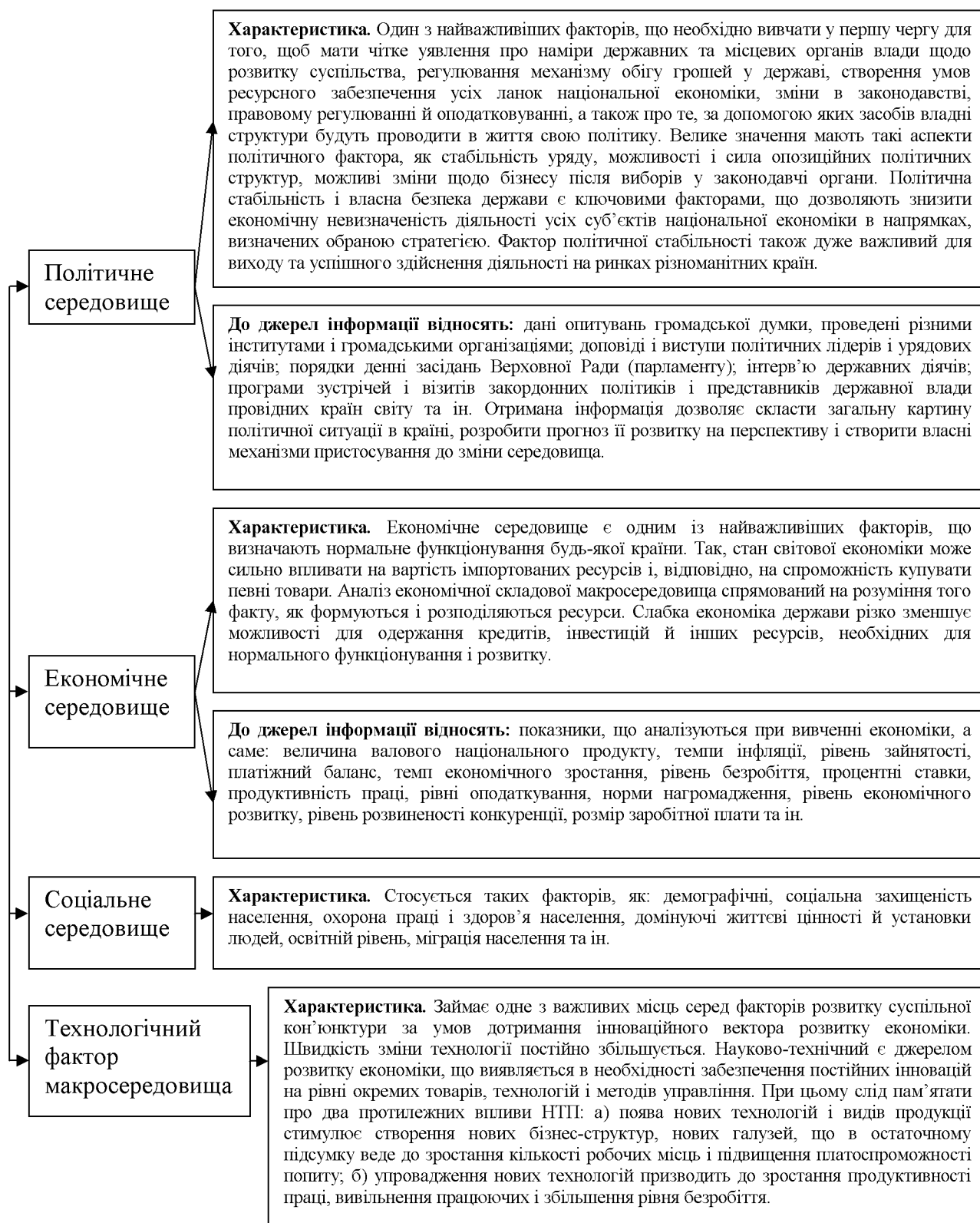
Рисунок 1 – Групи факторів PEST-аналізу