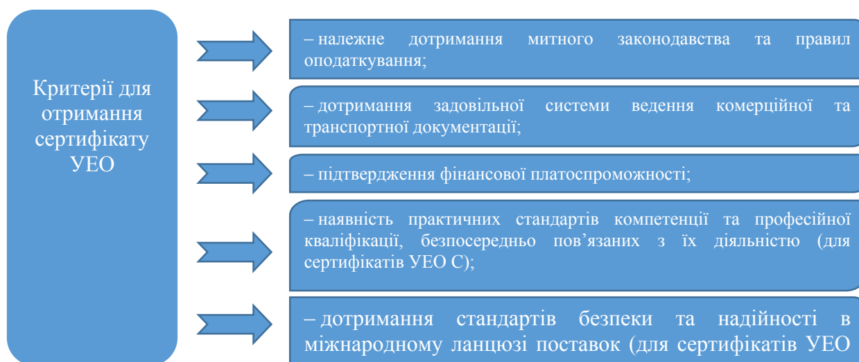
Рисунок 1 – Критерії для отримання сертифікату УЕО відповідно до ст. 39 МК ЄС та ст. 24-28 ІР ЄС

– якщо заявник здійснює ЗЕД менше трьох років, то митний орган компетентний приймати рішення щодо оцінки даного критерію на підставі доступних записів та інформації про заявника.