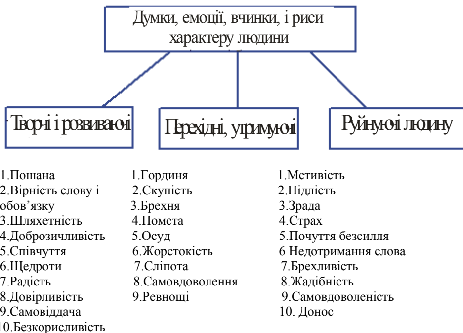
Рисунок 2 – Думки, емоції, вчинки, і риси характеру впливаючі на розвиток людини

І взагалі високі, безкорисливі помисли, ідеї, направлені на суспільні потреби, а не на власні, дуже високо цінуються Вищими Силами.