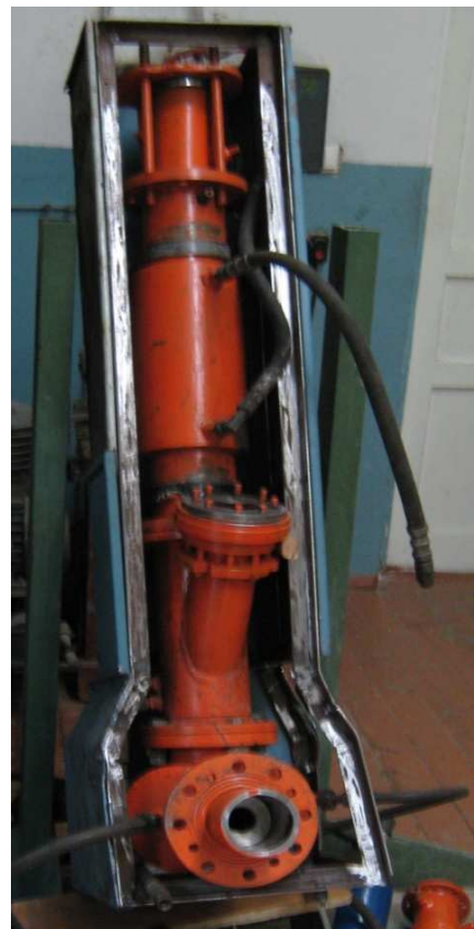
Рисунок 3 – Модульний газогідратний реактор

Для дослідження вищезгаданих механізмів і процесів утворення та розкладення газогідратів у природних геологічних структурах і за термобаричних параметрів, відповідно до умов ГГП Чорного моря в лабораторії «Газогідратні технології в нафтогазовому комплексі України» кафедри ВНГ ПолтНТУ розроблено проект експериментальної установки, основним елементом якої є модульний газогідратний реактор (рис. 3). У ньому можна буде підтримувати тем-