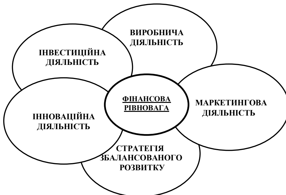
Рисунок 3 – Роль фінансової рівноваги в забезпеченні збалансованого розвитку промислового підприємства