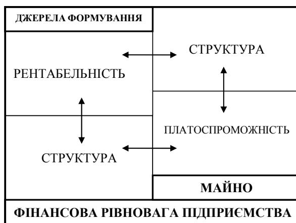
Рисунок 1 – Показники формування фінансової рівноваги підприємства

Отже, спираючись на [3], визначаємо фінансову рівновагу як певний стан підприємства, який відображує його спроможність забезпечення виконання власних фінансово-майнових зобов'язань перед іншими господарськими суб'єктами завдяки ефективно організованій роботі з власними засобами, за рахунок оптимальної структури активів підприємства та ефективності їх використання та правильно сформованих пасивів. Основні показники формування фінансової рівноваги підприємства представлено на рис. 1.