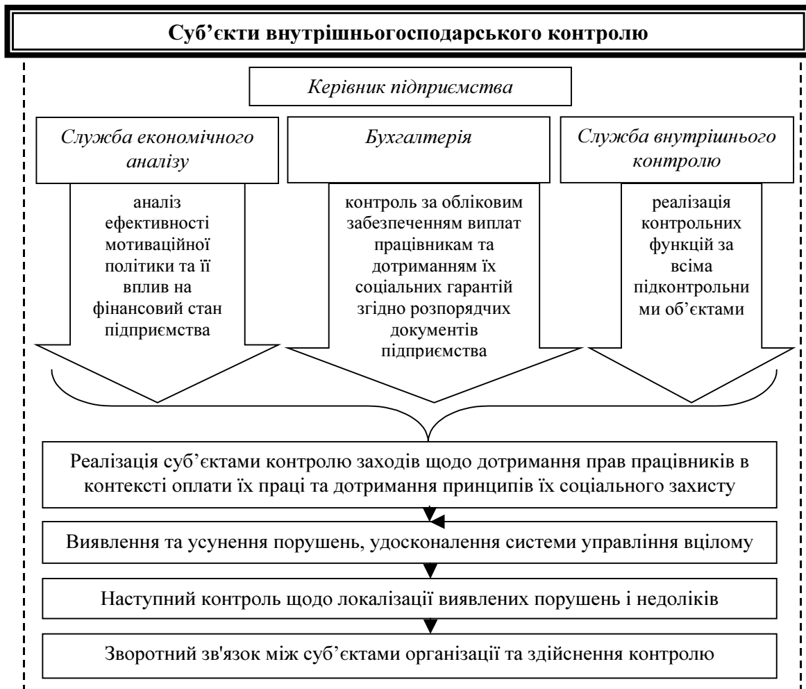
Рисунок 1 - Завдання суб'єктів внутрішньогосподарського контролю за дотриманням виплат працівникам

Пропонуємо суб'єктів внутрішнього контролю щодо забезпечення вимог оплати праці структурувати наступним чином (рис. 1.).