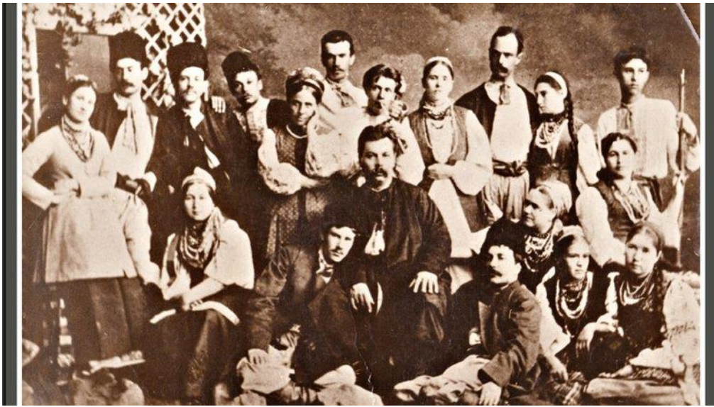
Рис. 2.2. Перша трупа Марка Кропивницького.

У жовтні того ж року на сцені зимового театру (нині – Кіровоградський академічний обласний український музично-драматичний театр ім. М. Л. Кропивницького) театральний сезон розпочався з вистави І. Котляревського «Наталка Полтавка», у якій головну роль зіграла Марія Заньковецька. Вистава продемонструвала високий рівень театального мистецтва і неповторну самобутність української культури.