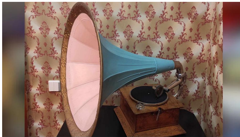
Рис. 2.6. Грамофон початку XX століття, який належав родині Кропивницького