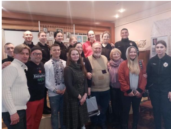
Рис. 2.10. Здобувачі кафедри історії, археології, інформаційної та архівної справи ЦНТУ на зустрічі з колективом Муніципального театру сатири.

М. Л. Кропивницького є проведення наукових конференцій, круглих столів та фахових дискусій, які піднімають цей діалог на глибший, аналітичний рівень. Саме такі заходи стають платформою для обміну науковими ідеями, новими підходами до інтерпретації спадщини Театру корифеїв, а також актуалізують постать Марка Кропивницького лише як митця, а й реформатора театральної культури.