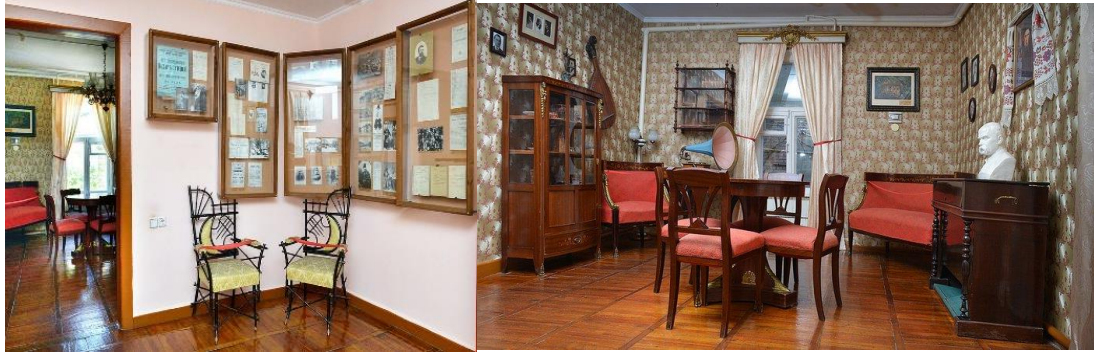
Рис. 2.4. Зали Меморіального музею М. Л. Кропивницького

Структура експозиції Меморіального музею М. Л. Кропивницького представлена такими тематичними блоками: