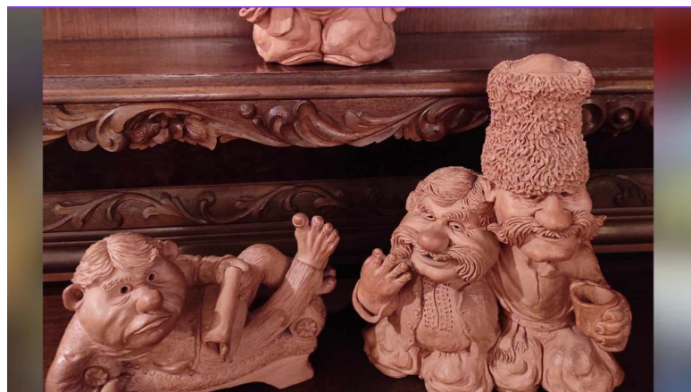
Рис. 2.7. Фігурки персонажів п'єс Марка Кропивницького

У музеях і меморіальних садибах такі речі не лише зберігаються – вони стають символами. Вони навчають, надихають, формують ідентичність. Тож