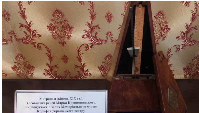
Рис. 2.5. Метроном, прилад для визначення темпу шляхом точного відліку тривалостей музичного метру