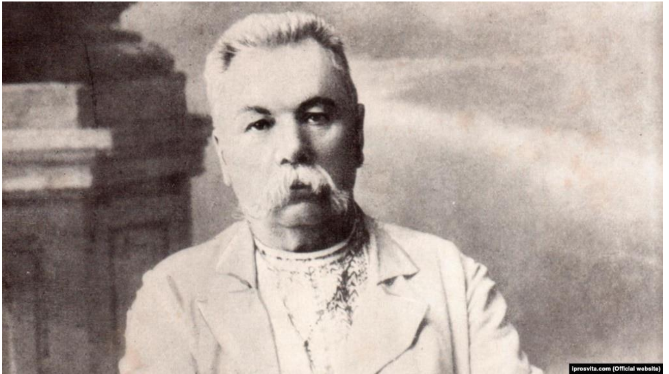
Марко Кропивницький (1840–1910), український письменник, драматург, театральний актор, засновник українського професійного театру Корифеїв