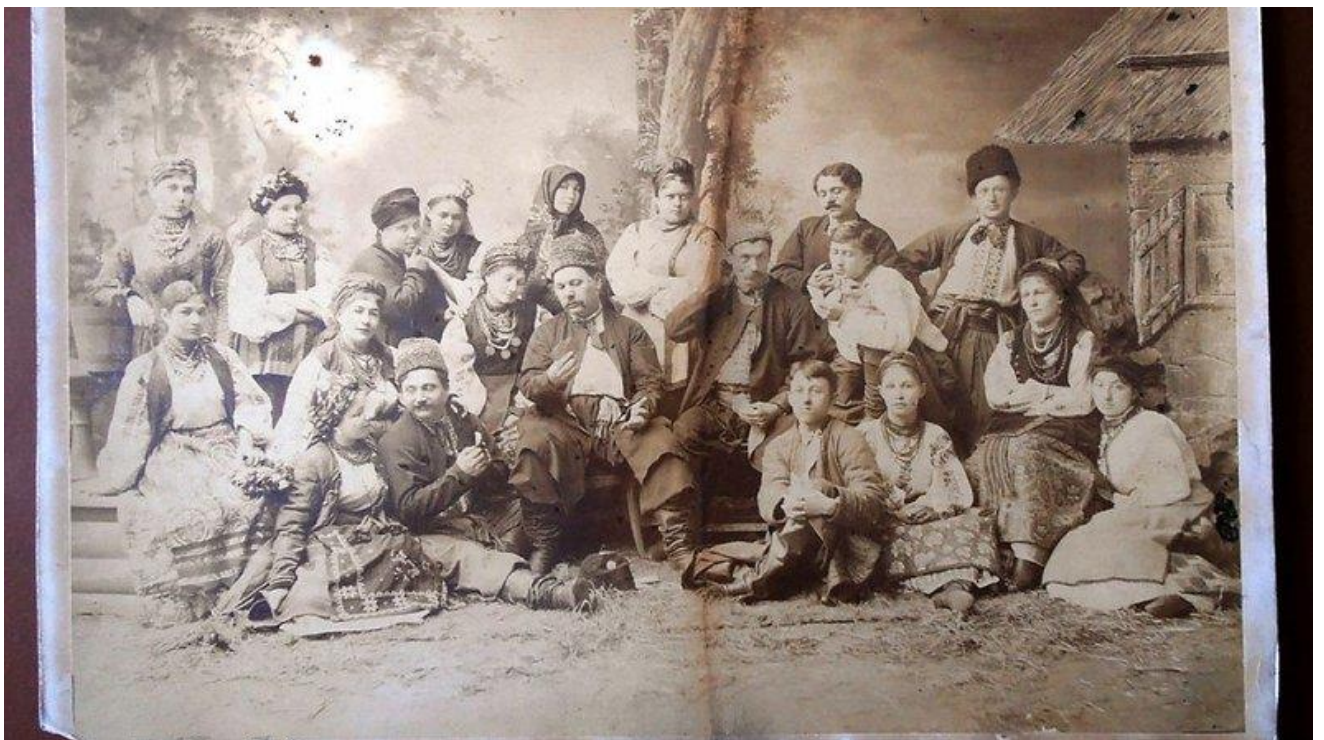
Театральна труппа Марка Кропивницького