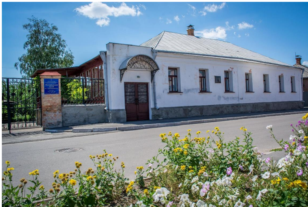
Рис. 2.1. Меморіальний музей М. Л. Кропивницького, розташований на розі вулиць Кропивницького і Смоленчука

цінність. Передусім він є матеріальним свідченням епохи, в яку жив і творив митець, зберігаючи атмосферу часу, що надихав його на створення визначних творів. Перетворення цього будинку на музей надає йому нового значення – він стає місцем культурної пам'яті, що об'єднує біографію драматурга з ширшим контекстом історії літератури, театру та суспільства.