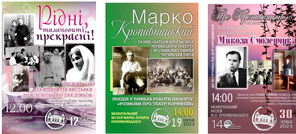
Рис. 2.8. Оголошення заходів проєкту «Розмови про Театр корифеїв»

У межах культурно-просвітницького проєкту «Розмови про Театр корифеїв», який реалізується Меморіальним музеєм Марка Кропивницького, лекції та бесіди виступають як ключовий інструмент збереження, популяризації та осмислення театральної спадщини України.