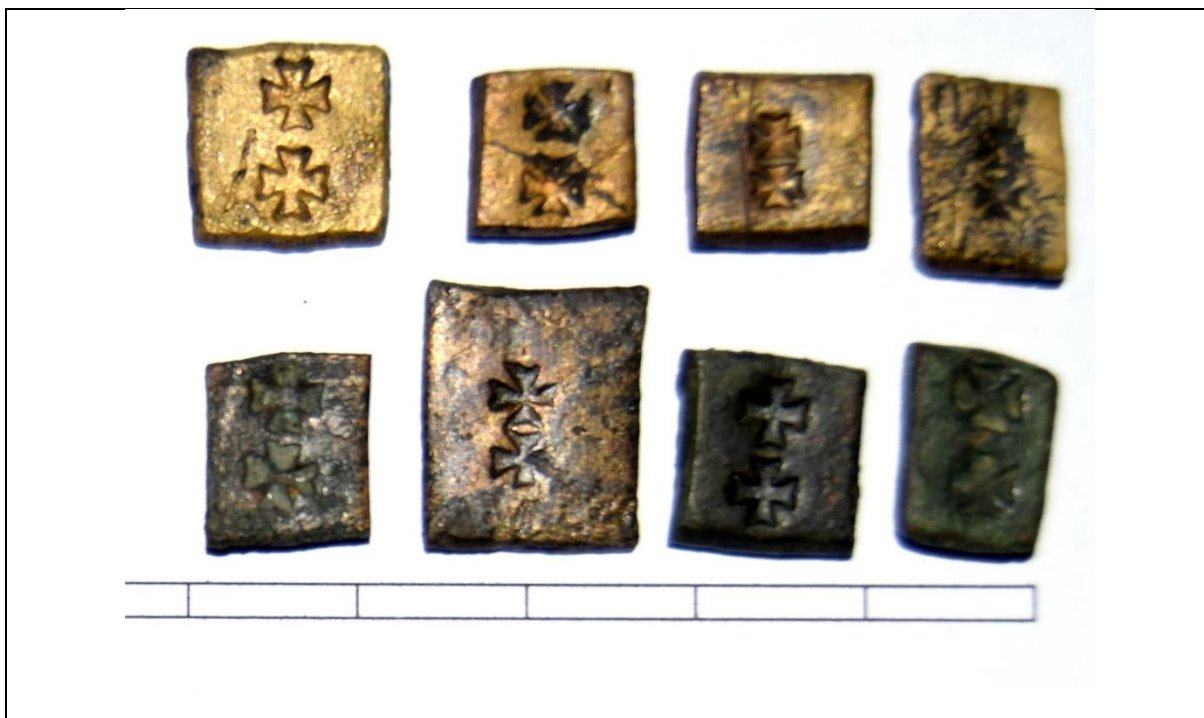
Fot. 1. Odważniki z godłem Gdańska (dwoma krzyżami bez korony) z XV/XVI w.

Przypuszczenie dotyczące gdańskich odważników dukatowych udało się potwierdzić znaleziskami archeologicznymi. Obecnie znane są dwa takie zabytki (Fot. 2)