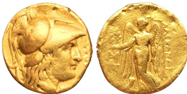
Рис. 1 (без масштабу)

Одним із таких значних елементів дискусії про «торговельний шлях від Чорного до Балтійського моря» стала знахідка у 2020 р. у західній частині Волинської області, поблизу р. Західний Буг, золотого статера з іменем Олександра Македонського (Рис. 1), про що міститься відповідна інформація на Інтернет-ресурсі Violity [7]. Дану знахідку ми можемо класифікувати як умовно достовірну (без археологічного контексту).