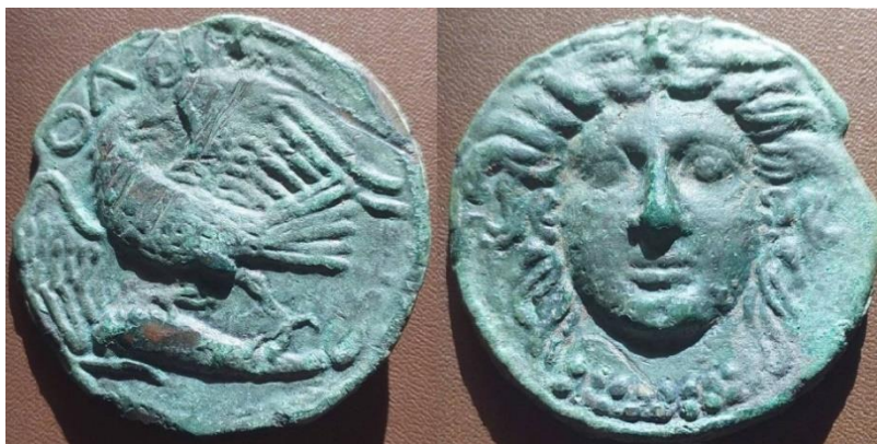
Рис. 1. Ольвія, тетробол, перша чверть IV ст. до РХ