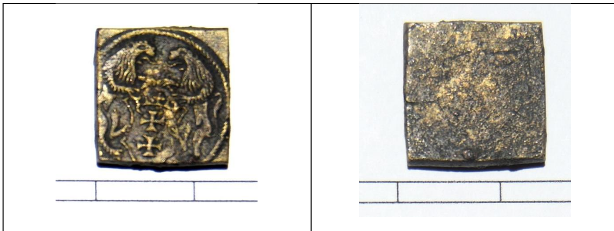
Fot. 2. Gdański odważnik dukatowy.

Przypuszczenie dotyczące gdańskich odważników dukatowych udało się potwierdzić znaleziskami archeologicznymi. Obecnie znane są dwa takie zabytki (Fot. 2)