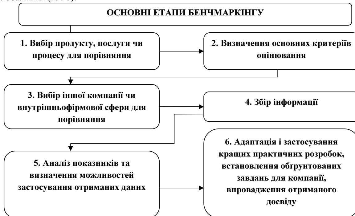
Рисунок 1 – Основні етапи бенчмаркінгу на підприємстві

За рівнем управління виокремлюють стратегічний, тактичний та оперативний види бенчмаркінгу. В еволюції розвитку теорії бенчмаркінгу можна виокремити такі три основні етапи: конкурентний (1972); диференційний (1982); стратегічний (1986); глобальний (1990).