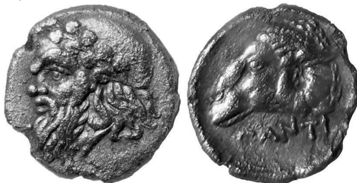
Рис.1. Без масштабу

Однією з таких монет є срібний діобол часів Сатира I ( Σάτυρος; 433/432-389/388 до н. е.) – царя Боспорської держави з династії Спартокідів, карбований у Пантикапеї (Рис.1).