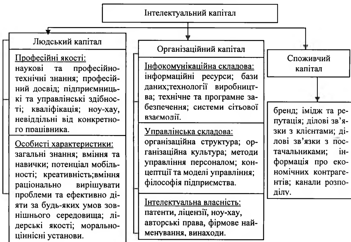
Рисунок 2 – Структура інтелектуального капіталу

Отже, на сьогодні існує багато підходів до структуризації інтелектуального капіталу, їх можна розділити на три групи. Перша група вчених дотримується думки, що інтелектуальний капітал складається з людського, організаційного та споживчого капіталів, друга група спрощує структуру, виділяючи лише людський та організаційний капітали, а представники третьої групи пропонують розширену структуру, виділяючи, окрім вище перерахованих складових, ще інтелектуальну власність, інфокомунікаційний та управлінський капітали, як самодостатні складові. Усі структурні складові взаємопов'язані, проте провідну роль в структурі інтелектуального капіталу відіграє людський капітал. На нашу думку, інтелектуальний капітал складається з людського капіталу, що включає професійні та особисті характеристики працівників, організаційного капіталу, до складу якого у свою чергу входять інфокомунікаційна, управлінська складові та інтелектуальна власність, а також споживчого капіталу.