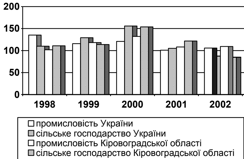
Рисунок 2 – Індекси цін на промислову та сільськогосподарську продукцію

В результаті здійснених реформ у сільському господарстві з'явився реальний власник, а сама власність стала джерелом отримання прибутків (капіталом) при орендних відносинах і при формуванні статутного фонду. Оскільки земля згідно законодавства не може бути внеском до статутного фонду, вона не є джерелом прибутку, а таким чином і не включається до складу капіталу, тобто не обліковується. Земля нині має грошову оцінку, тобто, згідно державної методики визначена її вартість, і хоч не вирішено питання щодо реальної оцінки землі, проведеною оцінкою користуються у більшості випадків. Завдяки такій оцінці вартості землі виникла можливість визначати сукупний аграрний капітал, до складу якого включено вартість землі.