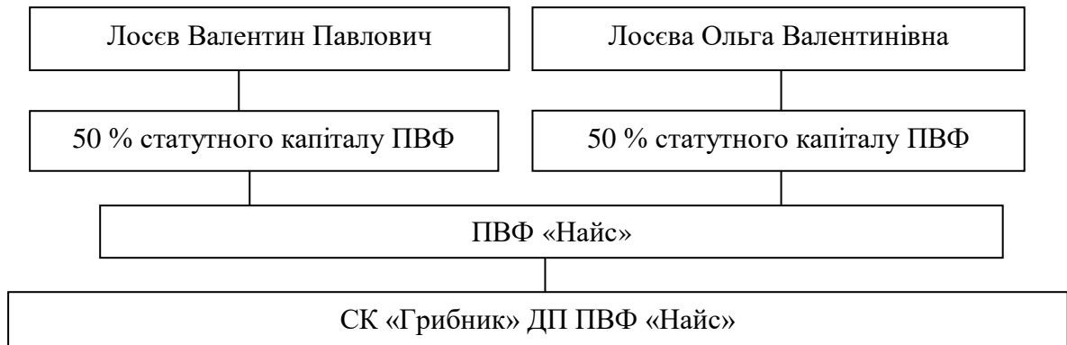
Рис. 1. Структура власності СК «Грибник» ДП ПВФ «Найс»

З метою забезпечення раціонального управління підприємством створено організаційну структуру з встановленим складом, рівнями підпорядкованості, взаємодією персоналу. Структуру власності СК «Грибник» відображено на рис. 1.