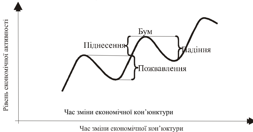
Рис. 1. Економічний цикл

Економічний цикл – це рух виробництва від закінчення попередньої кризи до початку наступної. Кожен цикл складається з п'яти фаз: криза, пожвавлення, піднесення, бум, падіння .