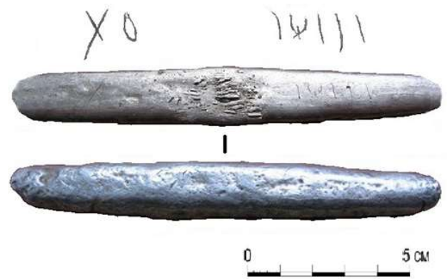
Рис. 4. Гривня литовського типу з прокресленими літерами «X O» та «I Ψ I I I» (?) та горизонтальними насічками зі скарбу 2014 р.