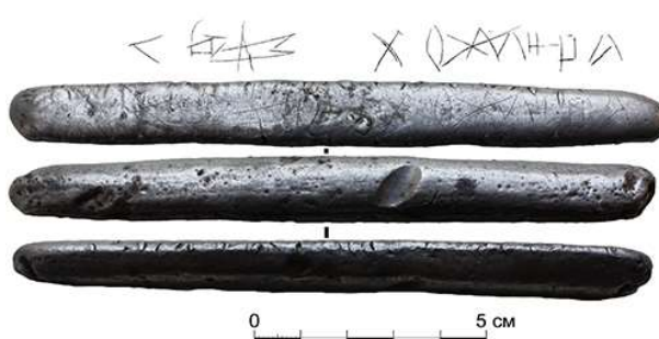
Рис. 2. Гривня литовського типу з прокресленим написом «Л Д Л М» та «Х О М Н Р А» зі скарбу 2014 р.