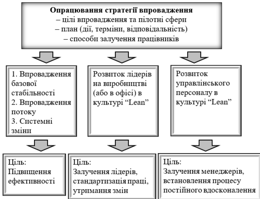
Рис. 2. Процес та цілі впровадження концепції "Lean" у процес виробництва та управління

Джерело: побудовано автором за матеріалами [2]