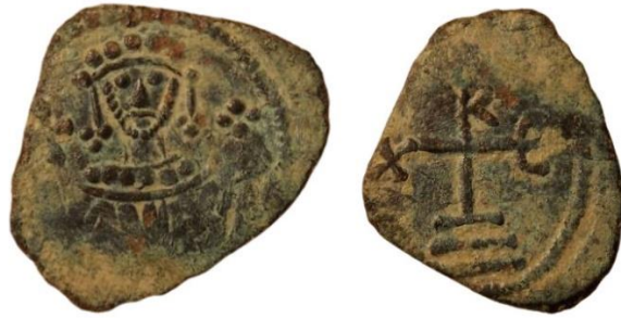
Рис. 1 Монета неправильної округлої форми, її діаметр – 17 мм, вага – 0,919 г.

Ав.: Погрудне зображення правителя з бородою та вусами.