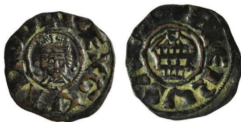
Рис. 5 (Coin of Guy de Lusignan)

Ав.: бюст Гі де Лузіньяна в анфас, по колу легенда REX GVIDO D Рев.: Храм Гробу Господнього з круглим куполом, по колу легенда +E IERVSALEM Вага – 1,03 г, діаметр – 17 мм.