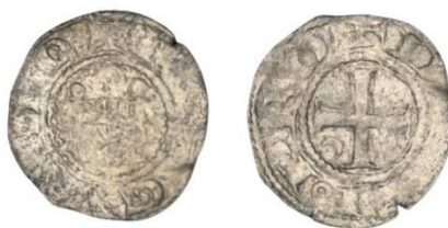
Рис. 6 (Billon Denier)

Після емісій хрестоносцями цих двох типів монет на о. Кіпр була сформована нова, характерна для держав хрестоносців, монетно-вагова система. Наступні емісії монет Гі де Лузіньяна на Кіпрі складали білонові монети вагою 1,2 г із восьмикутною зіркою на аверсі та круговою легендою +REX GVIDO і хрестом на реверсі з круговою легендою +DE CIPRO (Coins of the Crusader: 269). Наступний тип білонових деньє Гі де Лузіньяна карбувався вагою близько 0,80 г. Монети містили на аверсі зображення вежі/воріт, а на реверсі хрест, у сегментах якого симетрично зображалися 2 півмісяці та 2 крапки (Рис. 6) або лише 4 крапки. Ці монети мали аналогічні легенди з тими, що мали місце на монетах з восьмикутною зіркою.