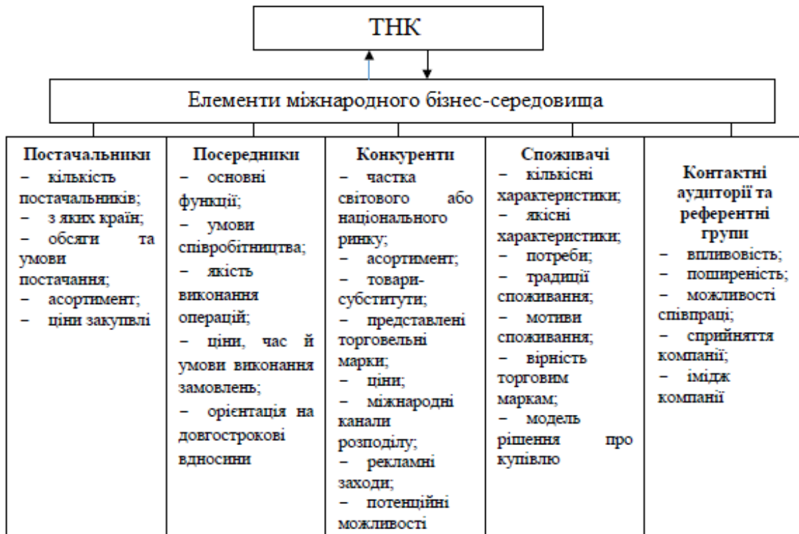
Рис. 1.1. Складові міжнародного бізнес-середовища діяльності ТНК