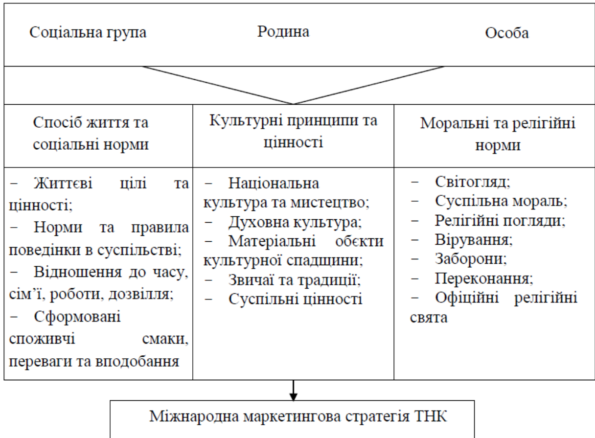
Рис. 1.2. Елементи соціально-культурного середовища бізнес-діяльності ТНК

середовища, що враховує не тільки макро- і мікросередовище, а й мезосередовище [50].