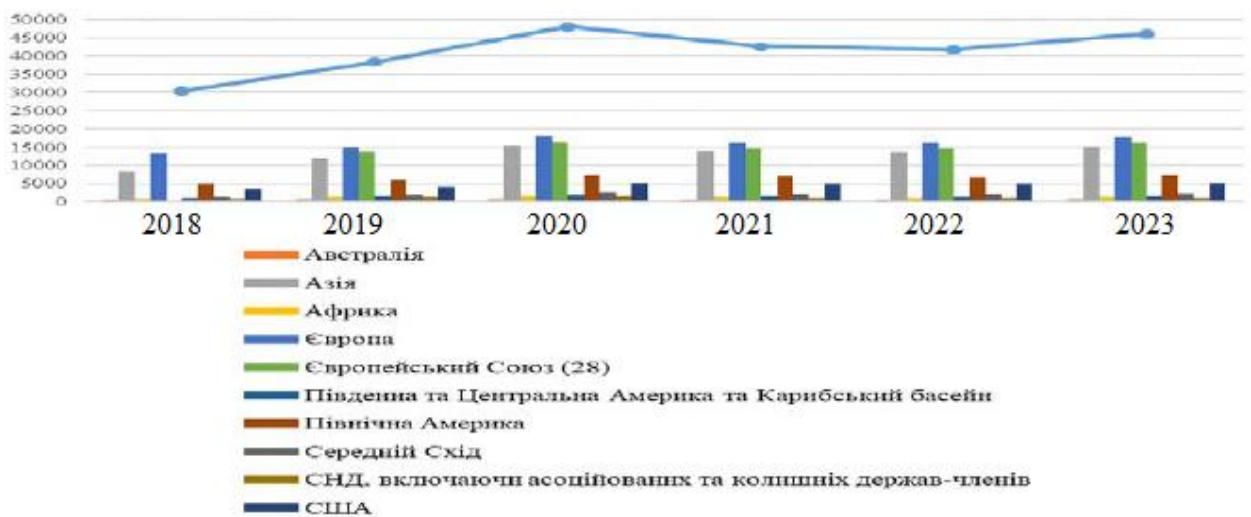
Рис. 2.1. Регіональна динаміка міжнародної торгівлі у 2018-2023 рр.

Потенціал зростання Африки сильно залежить від коливань цін на сировинні товари. За прогнозами демографів, у найближчі 20 років в Африці спостерігатиметься найбільший приріст населення працездатного віку (15-64 роки). Це може стати як економічним благом, так і серйозним дестабілізуючим фактором, якщо уряди не створять необхідних умов для використання виробничого потенціалу працездатного населення. Водночас експерти переконані, що країни, які розвиваються, відіграватимуть важливу роль у глобальному економічному розвитку в XXI столітті. Аналіз регіональних трансформацій у міжнародній торгівлі лише підтверджує тенденції, що намітилися останніми роками (рис. 2.1).