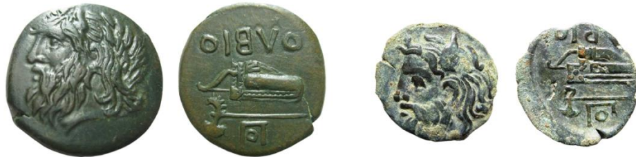
Рис.1. Зліва: «Борисфен» №3, близько 328 р. до Р. Х., магістрат Поликсен, батько епоніма 309 р. до Р. Х. Афенея Поликсенова. Справа: «Борисфен» № 66 близько 250 р. до Р. Х., магістрат Поликсен, батько епоніма 214 р. до Р. Х. Гікесія Поликсенова

2. Монограма Η присутня на монеті «Деметра зі стінною короною-стрілець». За В. Ф. Столбою (Stolba, 2015) вона датується 330–327 р. до Р.Х. Монограма відповідає реальній історичній особі на ім'я Ἡρόδωρος τοῦ δεῖνος – батькові епонімів 302 та 301 рр. до Р.Х., відповідно, Теодекта (Θεοδέκτης Ἡροδώρου) та Ленея (Λήναιος Ἡροδώρου) з роду Геродорів. Успадкування цієї монограми на «Борисфені» № 65 орієнтовно 254 р. до Р.Х. належить батькові епоніма 212 р. до Р.Х. Стафіла Геродорова (Στάφυλος Ἡροδώρου) з роду Геродорів. Ця особа згадана у декреті ΙΡΕ Ι 2 32 на честь Протогена у якості жреця-епоніма. Подолання альтернативи досягнуто через сумісний розгляд декількох суміжних монограм.