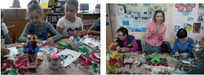
Рис.3. Проведення майстер-класів