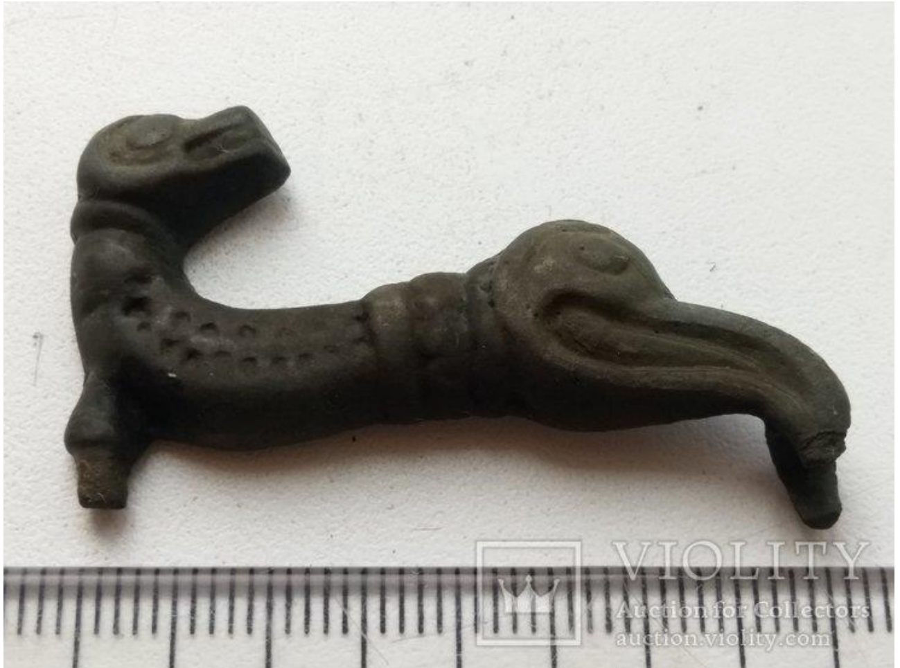
Рис. 5. Фібула V–VII століть нової ери.