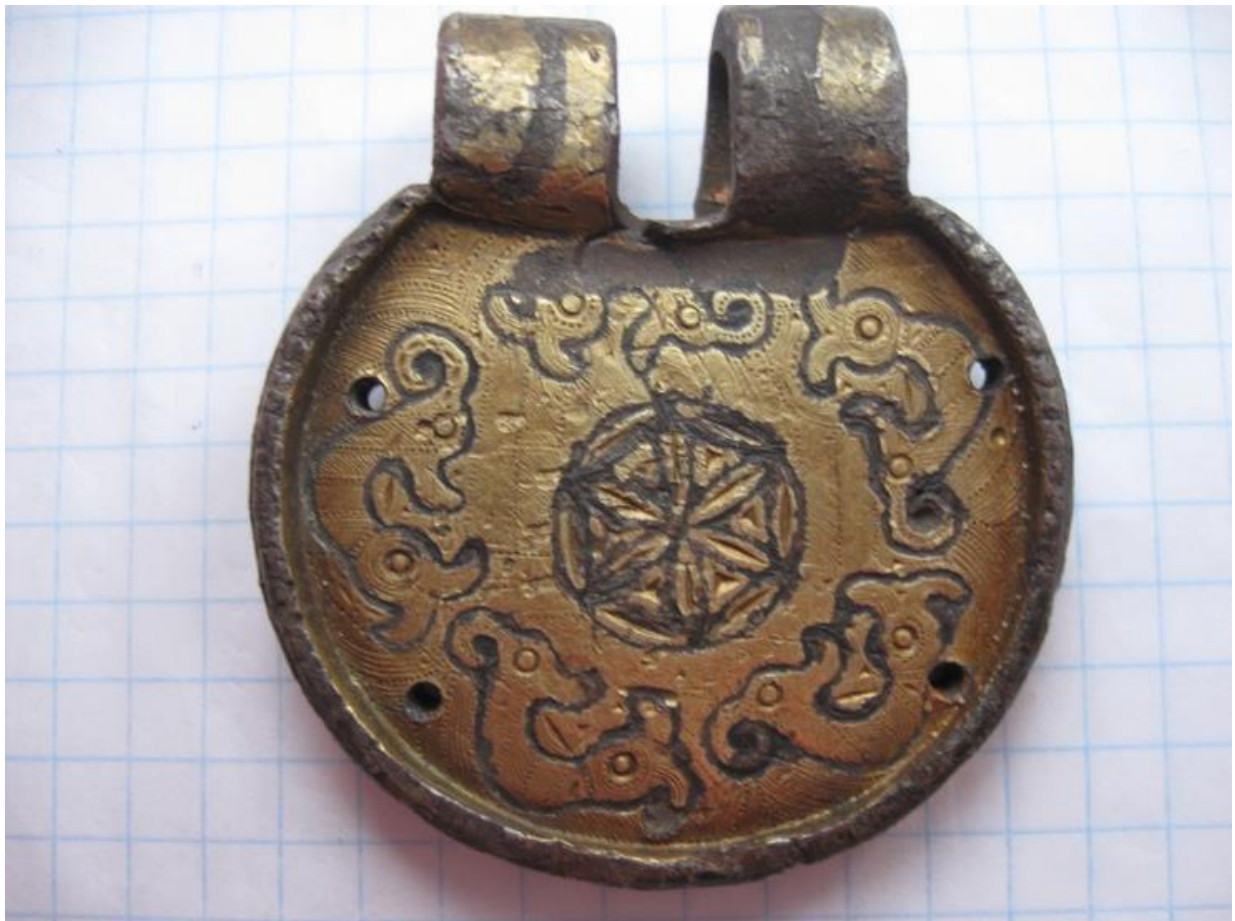
Рис. 1. Центральна частина готської пряжки, знайденої в Сумській області