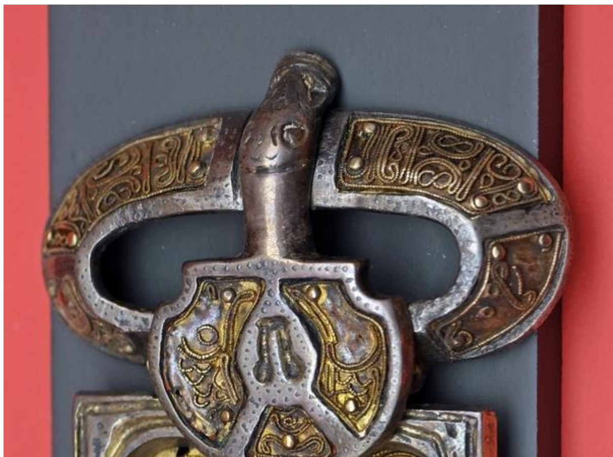
Рис. 4. Ремінні готські пряжки.