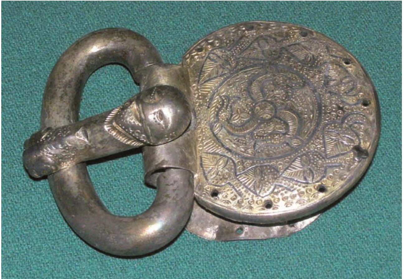
Рис. 6. Готська пряжка, знайдена в Ялті.