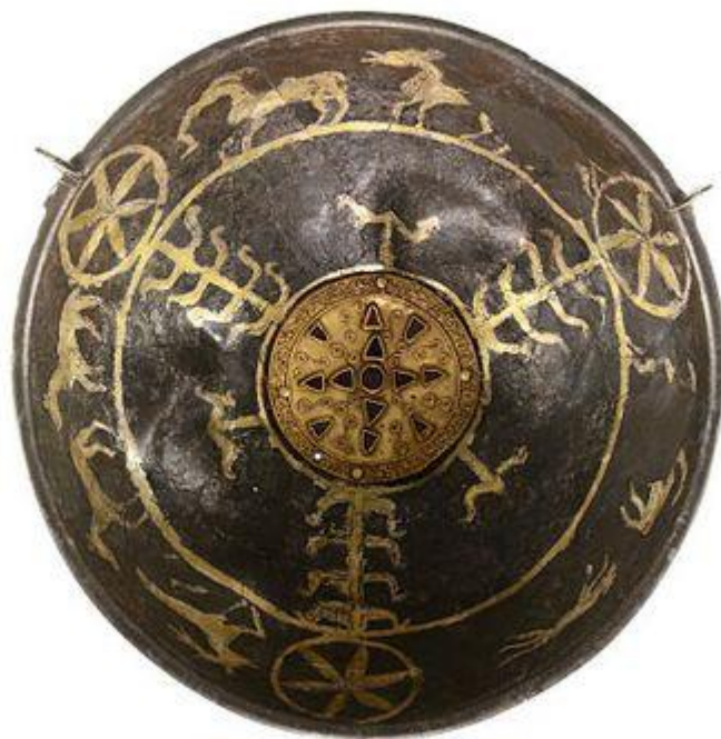
Рис. 3. Срібна чаша першої половини сьомого століття, знайдена поблизу голландського міста Угстгест (нід. Oegstgeest ) у нідерландській провінції Південна Голландія.