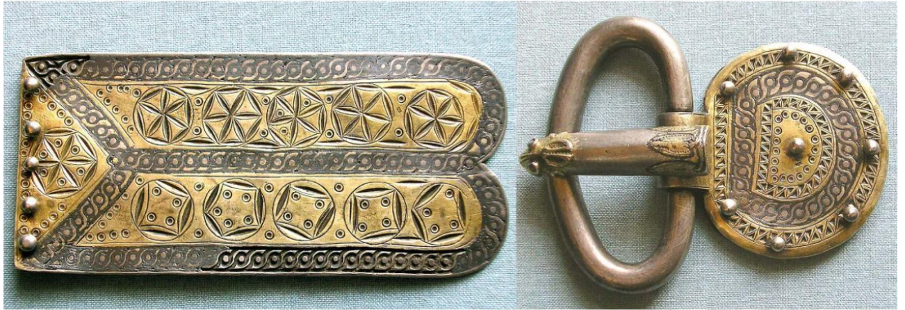
Рис. 2. Частина готського ремінного набору V–VI століть нової ери