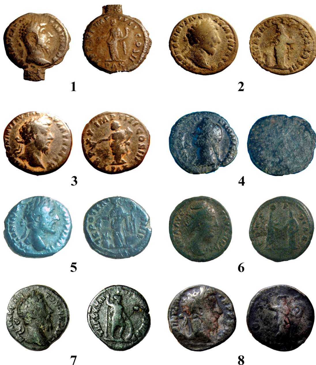
Рис. 1. Литые денарии. Брестская область (Побужье и Припятское Полесье): 1–2 – д. Пожежин, Малоритский район; 3 – д. Дружба, Брестский район; 4 – окрестности Бреста; 5 – д. Чижевщина, Жабинковский район; 6 – д. Демянчицы, Каменецкий район; 7 – д. Площево, Пинский район; 8 – д. Рубель, Столинский район.