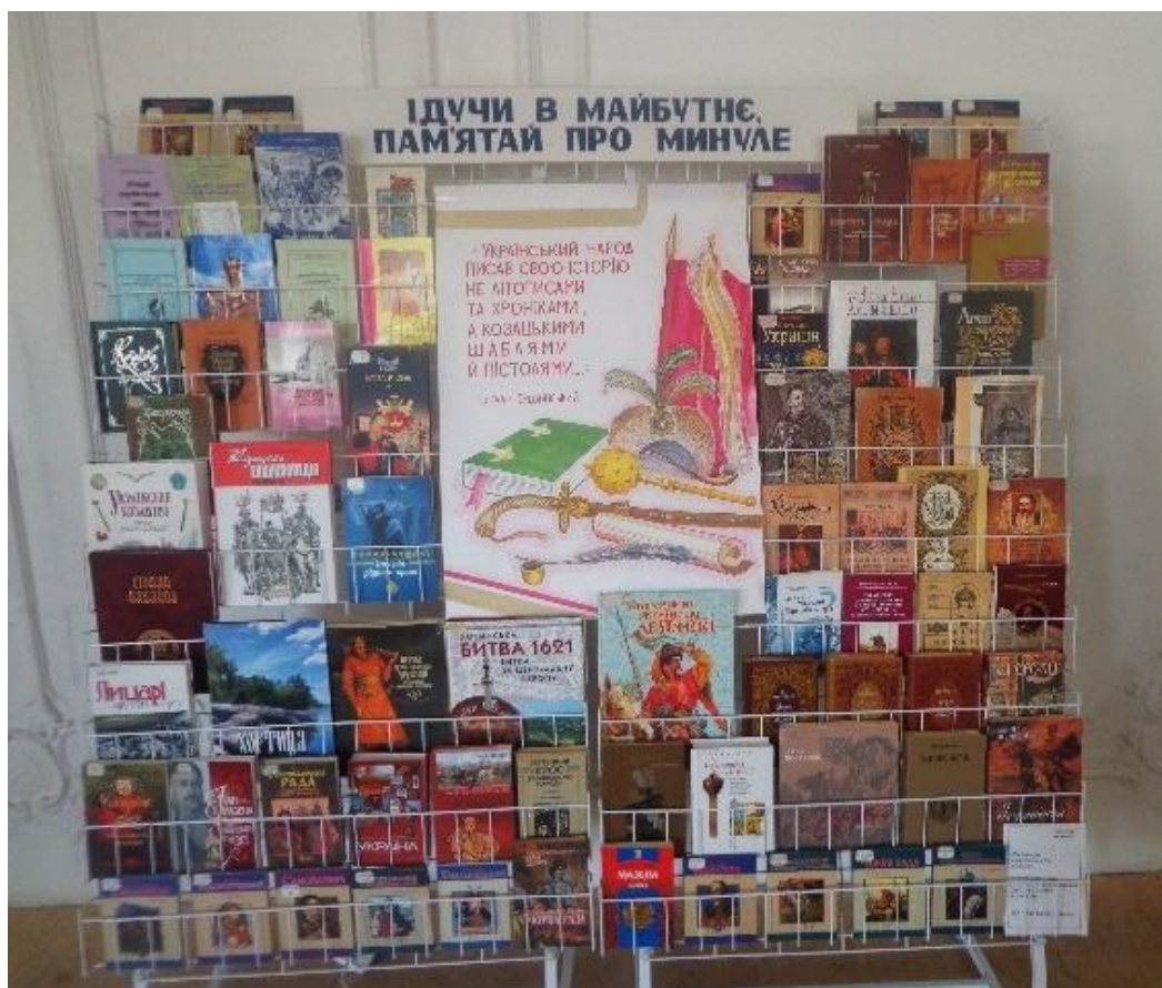
«Йдучи в майбутнє, пам'ятай про минуле»