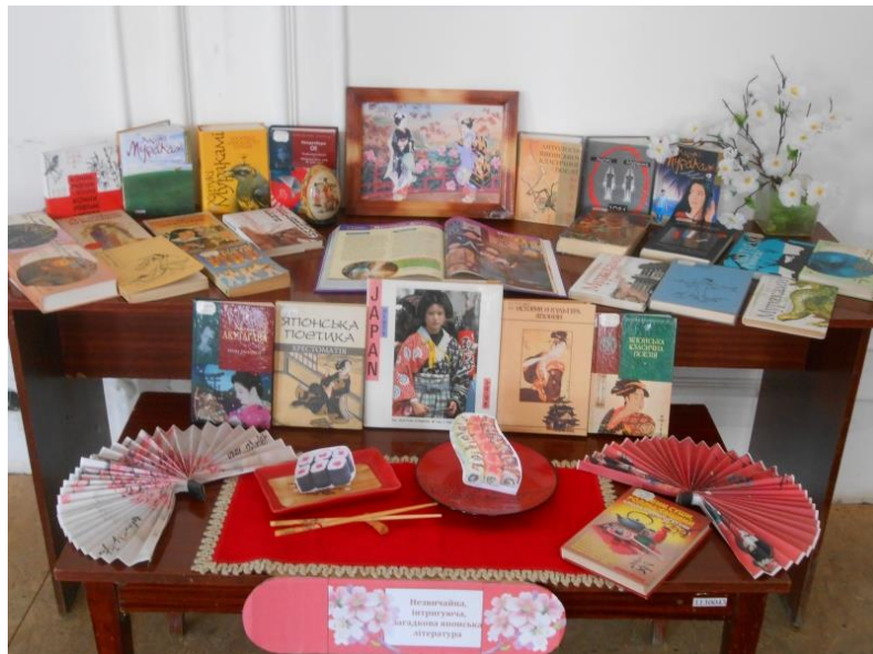
«Японія – далека і близька»