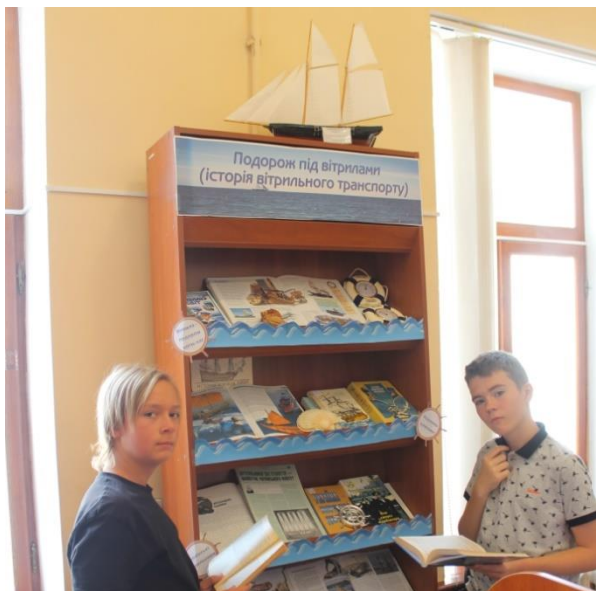
«Подорож під вітрилами» (історія вітрильного транспорту)