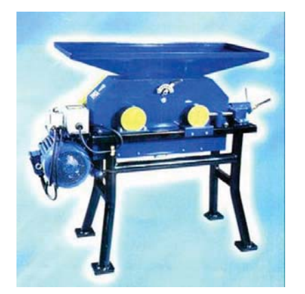
Рисунок 1. – Плющилка для зерна ПЗ-600 Джерело: використано [10]

Агрегат для плющення зерна ПЗ-600 (рис.1) призначений для плющення зерна любої культури. Засвоюваність отриманої маси підвищується на 30% порівняно з роздробленою. При роботі агрегату виключається запиленість приміщення. Не утворюється борошно, тим самим виключається руйнування білка. Менше споживання електроенергії порівняно з дробленням. Потужність електродвигуна – 7кВт. Продуктивність до 1000 кг/год. Агрегат простий в експлуатації.