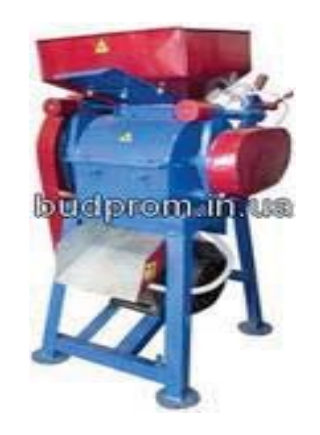
Рисунок 2 – Валкова-плющилка ВПК-150