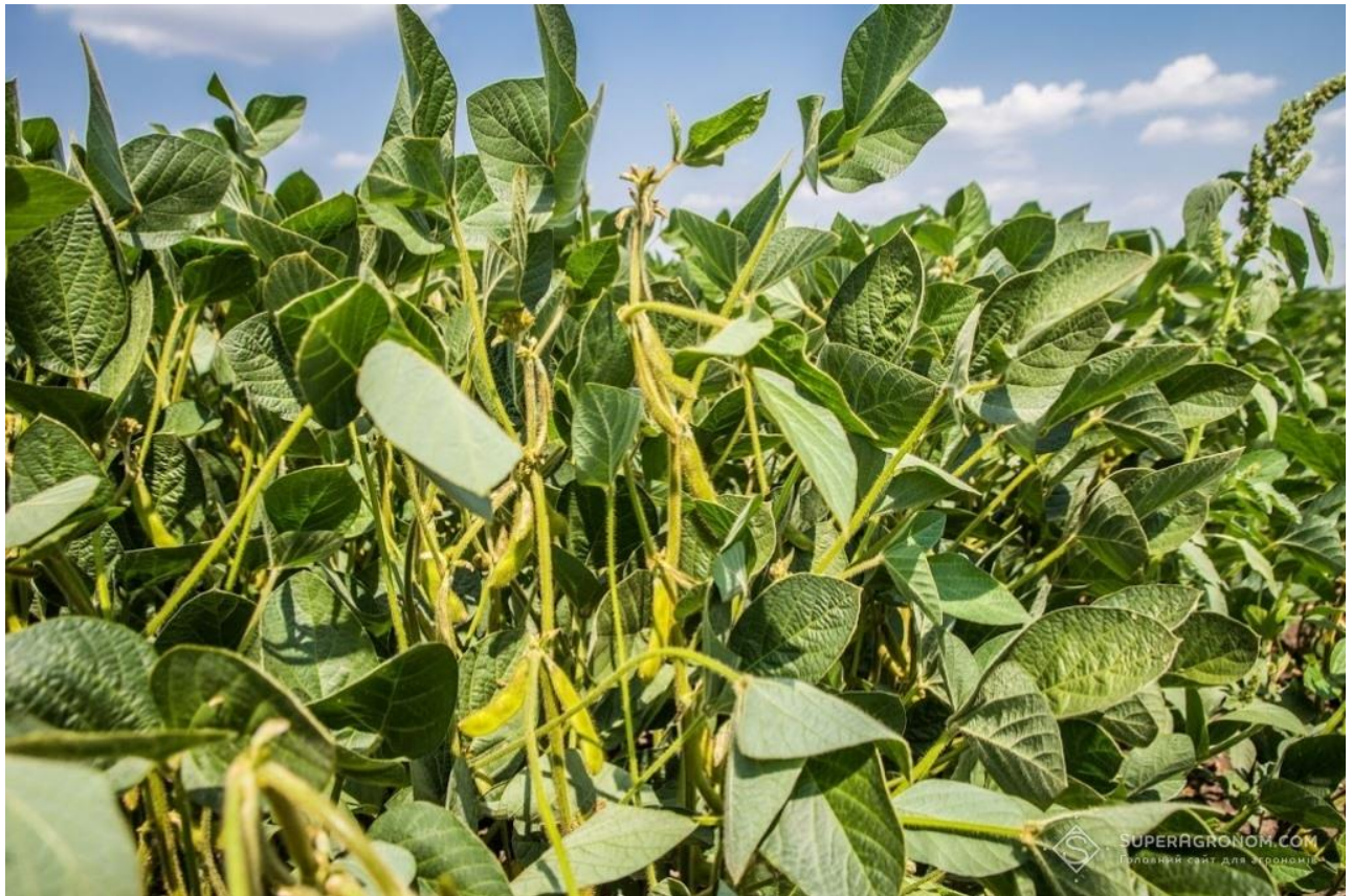
Рисунок 2.1 – Рослини сої

Соя має добре розвинену стрижневу кореневу систему з бічними коренями, які можуть проникати у ґрунт на глибину до 1,5-2 м. На коренях утворюються бульбочкові бактерії ( Bradyrhizobium japonicum ), які фіксують атмосферний азот і забезпечують рослину необхідними поживними речовинами.