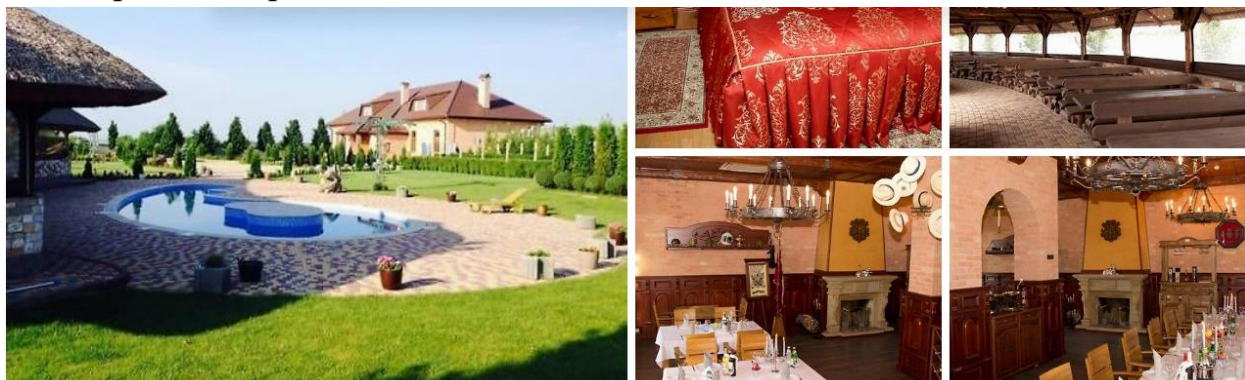
Рис. 1. Фотоколаж умов для гостей у парк-отелі «Maetok Country Club» на Кропивниччині, що в період воєнного стану позиціює себе як осередок затишного заміського відпочинку від стресів війни для всієї родини та їхніх домашніх тварин.

а користуватися послугами українських парк-отелів центрального, східного й південного регіонів країни.