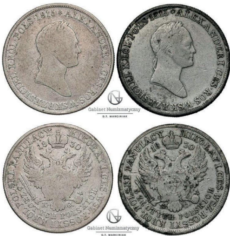
Рис. 6. Царство Польське, 5 злотих 1830 року державного зразка та виконана за її прототипом тогочасна підробка з олова

Варто також відзначити, що об'єктами продажу на нумізматичних аукціонах часто стають найрізноманітніші тогочасні підробки різних періодів та характерних для різних регіонів. Так, на популярному в Польщі аукціоні «Познанський Аукціонний Дім» власника Сергіуша Штюбе було продано безліч тогочасних фальсифікатів монет за прототипом срібних дрібних розмінних монет Речі Посполитої – трояків та півтораків 20 .