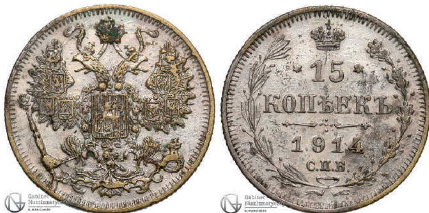
Рис. 1. Фальшиві 15 копійок 1914 року. Вага: 2,53 г.

монет та банкнот, які є німими свідками подій Першої світової війни, знані і на колекційному ринку 10 . Відомий нумізмічний аукціон «Gabinet Numismatyczny D. Marciniak» декілька разів виставляв у продаж підробки: 15 копійок 1914 року (Рис. 1) 11 , 50 польських марок 1916 року 12 , а також фальшивий рубль для міста Лодзь 1915 року 13 .