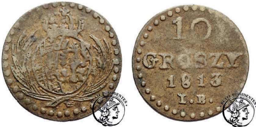
Рис. 5. Фальшиві 10 грошів зразка 1813 року

Рідкісними та не менш цікавими є підробки паперових грошових знаків – асигнацій, кредитних білетів та грошових сурогатів. Серед тогочасних підробок паперових грошових знаків у Польщі варто відзначити фальшивий касовий білет 5 злотих зразка 1830 (Рис. 7.), продані на аукціоні «Warszawski Centrum Numizmatyczne» 19 . Фальшива банкнота містить серію А 1315160, а також підписи Т. Szymanowski та L. Plater.