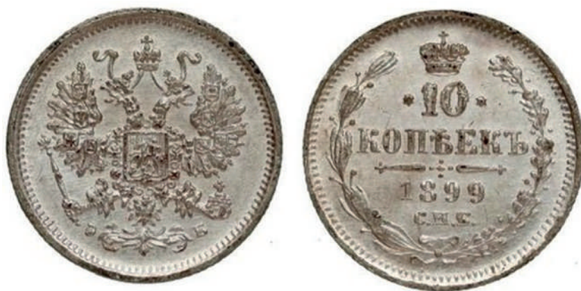
Рис. 2. Фальшиві 10 копійок 1899 року. Вага: 1,56 г.