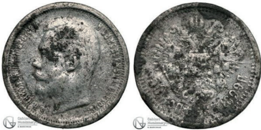
Рис. 4. Фальшиві 50 копійок 1899 року. Вага: 8,28 г.

Подальше використання пошукової системи аукціону дозволило виявити нові продані лоти, що належать до продукції фальшивомонетників імперської доби.