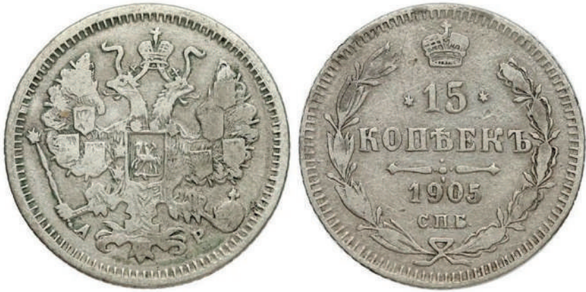
Рис. 3. Фальшиві 15 копійок 1905 року. Вага: 2,38 г.