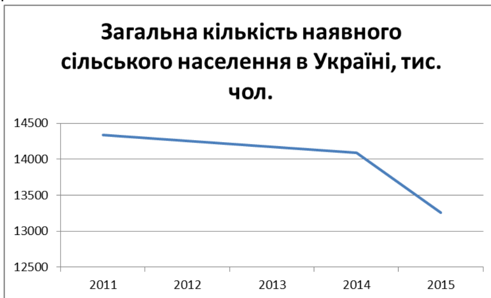
Рис. 2. Динаміка наявного сільського населення України в 2011-2015 роках

* – без урахування тимчасово окупованої території Автономної Республіки Крим і м. Севастополя.