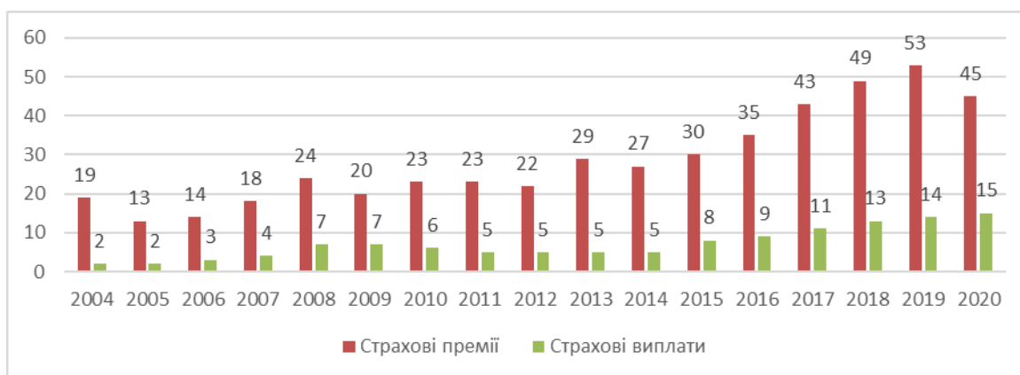
Рис. 2 - Динаміка страхових премій та страхових виплат на страховому ринку України за 2004-2020рр., млрд. грн.

Важливим показником діяльності страхових компаній є величина отриманих ними страхових премій від страхувальників (рис.2).