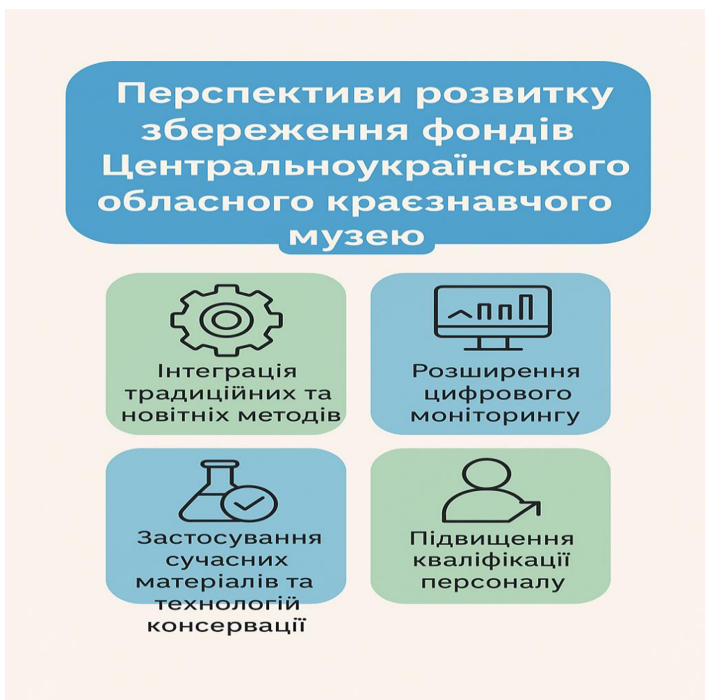
Рис.3.2. Перспективи розвитку збереження фондів Центральноукраїнського обласного краєзнавчого музею

Впровадження цих рекомендацій дозволить Центральноукраїнському обласному краєзнавчому музею поєднувати традиційні методи збереження з