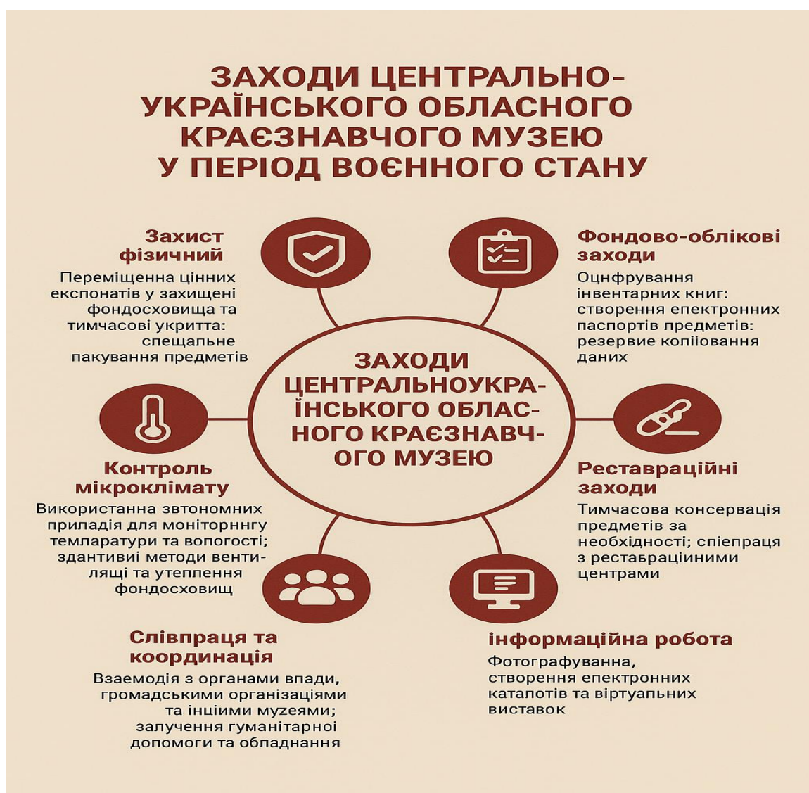
Рис. 3.1. Заходи Центральноукраїнського обласного краєзнавчого музею у період воєнного стану

Для запобігання загрозам музеї використовується комплекс заходів, а саме: