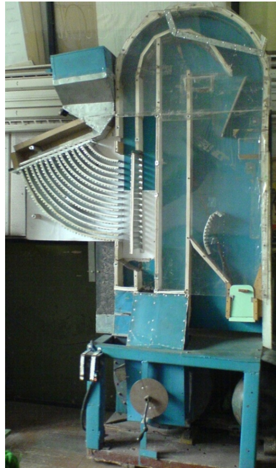
Рисунок 2 – Схема та загальний вигляд пневмосепаратора з живильним пристроєм для багаторівневого введення зернового матеріалу.

Живильний пристрій працює таким чином. Вихідний матеріал з бункера 1 поступає на розподільчу пластину 9 живильного пристрою 3, яка встановлена під кутом до горизонту, що дозволяє зерновій суміші рухатись з достатньою швидкістю. Далі зерновий матеріал просипається в отвори в пластині та потрапляє на направляючі поверхні живильного пристрою 8, які встановлені одна над одною, і тонкими шарами вводиться в робочу зону ПСК 4. Продуктивність пневмосепаратора регулюється заслінкою 2.