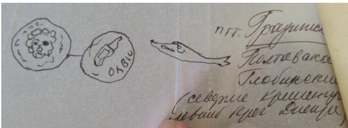
Рис. 2. Власноручне виконання контурного абрису монети, додане до листа Петру Каришковському від учасника археологічної експедиції на Полтавщині.