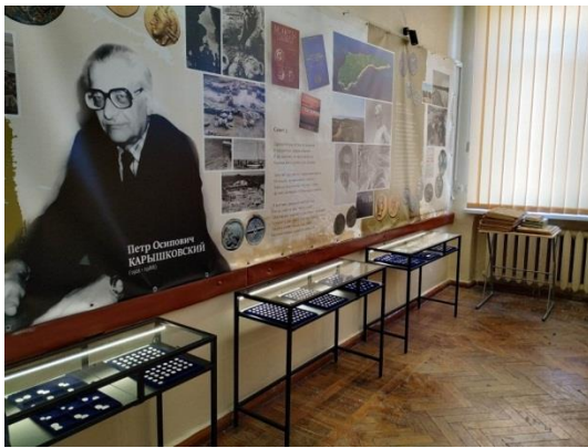
Рис. 4. Експозиція музею «Нумізматична колекція професора Петра Йосиповича Каришковського»