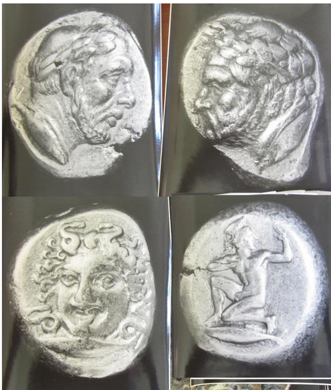
Рис. 1. Фотографії золотих монет Кізіка 1 .