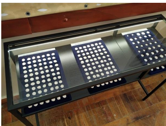
Рис. 5. Вітрина із гіпсовими моделями монет із "Дороцького" скарбу IV ст. до н.е.