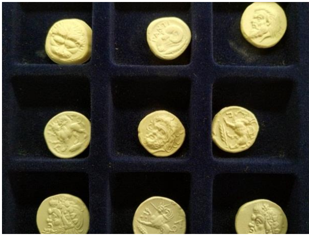
Рис. 6. Гіпсові моделі золотих статерів Пантікапею