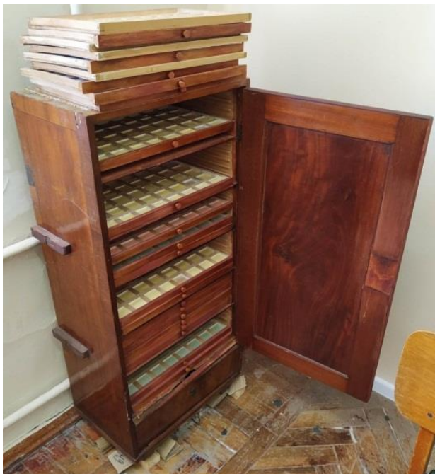
Рис. 7. Мюнц-кабінет Петра Йосиповича Каришковського для зберігання наукового архіву гіпсових моделей