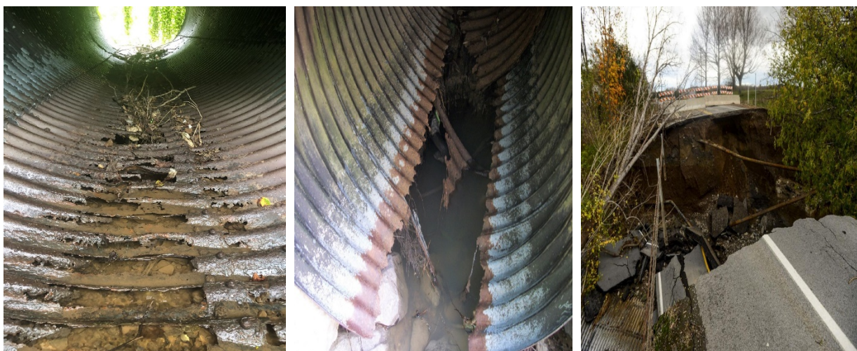
Рисунок 1 – Наслідки впливу корозії на дорожню водопропускну трубу з МГК