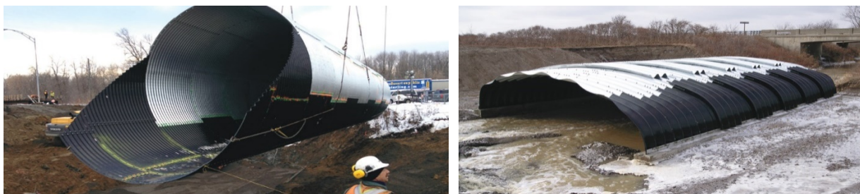
Рисунок 3 – Застосування термопластичних пластин

Сучасні термопластичні системи (рис. 3) дають можливість підвищити термін експлуатування до 75 — 100 років [7].