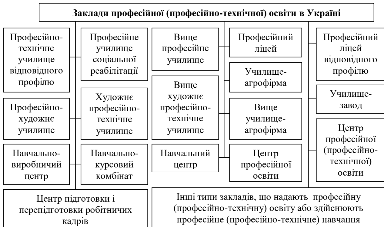
Рис. 1. Перелік закладів професійної (професійно-технічної) освіти*

Така освіта здобувається у відповідних закладах, перелік яких встановлено Законом України «Про професійну (професійно-технічну) освіту» від 10.02.1998 р. № 103/98-ВР (редакція від 01.01.2021 р.) [1] (рис. 1).