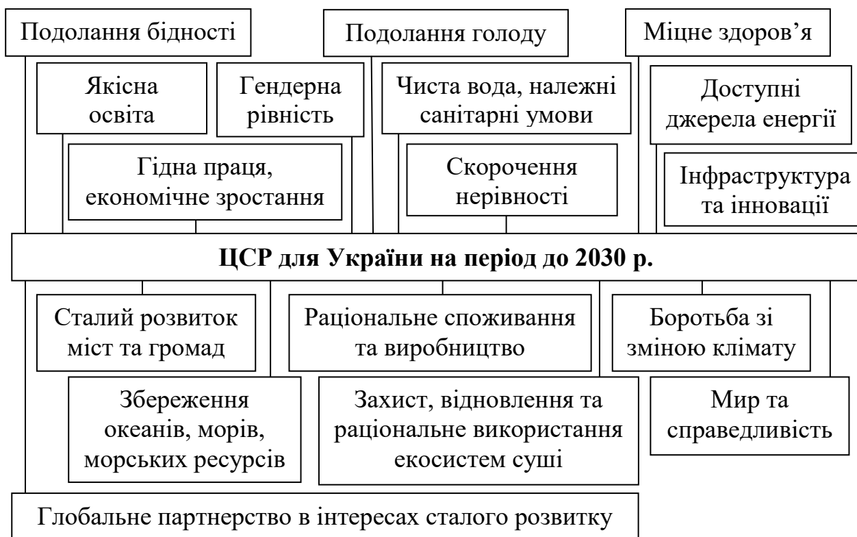
Рис. 2. ЦСР для України на період до 2030 р.

Такий підхід у розвитку підприємницьких структур цілком відповідає закріпленим Указом Президента № 722/2019 ЦСР для України на період до 2030 р. (рис. 2) [4].