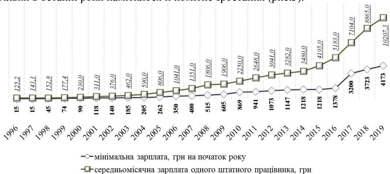
Рис. 3 - Динаміка мінімальної, середньої зарплати в Україні у 1996 – 2019 рр., грн.

Разом із тим практика реформування в Україні так чи інакше засвідчує орієнтацію державної політики на утримання низької вартості робочої сили. Тільки в останні роки намітилося її помітне зростання (рис.3).