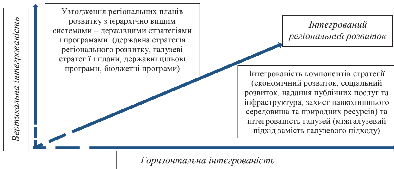
Рисунок 1 – Виміри інтегрованості регіонального розвитку

інтерпретується як поєднання секторальної (галузевої), територіальної (просторової) та управлінської складових державної регіональної політики [16].