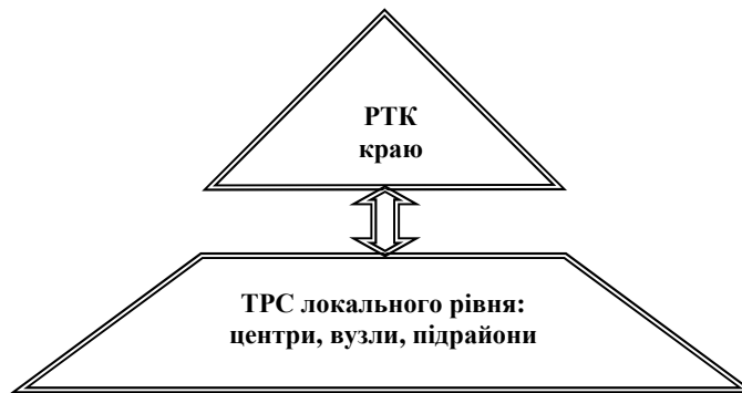
Рис. 2. Основні об'єкти туристичного краєзнавства

ному вимірі — рекреаційно-туристичний комплекс (РТК) краю . Іншими словами, об'єктом дослідження є рідний край через призму його туристичної самобутності.