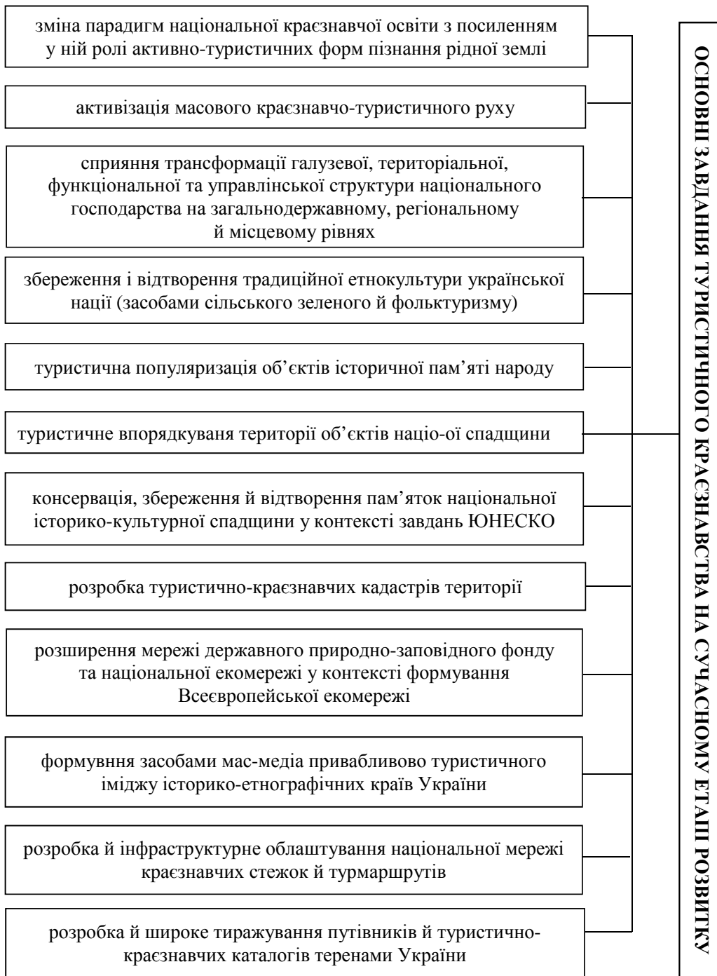
Рис. 4. Основні завдання туристичного краєзнавства на сучасному етапі

Значна частина названих завдань має «лягти на плечі» науковців й активістів низових краєзнавчих організацій. Передусім від їхньої принципової позиції і подвижницької праці залежатиме, в якому стані перебуватимуть українські замки і фортеці (чи їх атракційні фрагменти), музеї історії і природи просто неба, заповідні урочища та поля археологічних розкопів чи історичних битв тощо. А також — те, кого