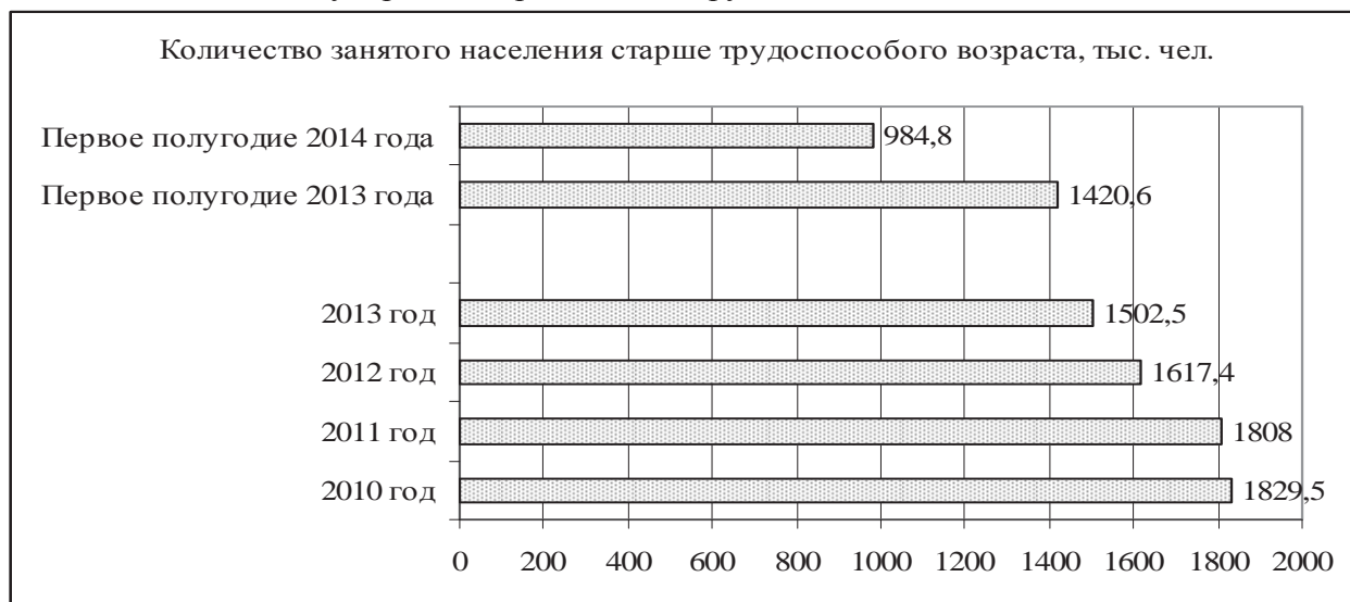
Рис. 2. Динамика занятости населения старше трудоспособного возраста

Закономерным становится сокращение притока молодой рабочей силы на предприятия и увеличение доли лиц старшего возраста. Вместе с тем последствия мирового финансового кризиса и системного кризиса в Украине заставили работодателей оптимизировать затраты на персонал путем сокращения штатов за счет пенсионеров. Рис. 2 отражает тенденцию уменьшения количества занятого населения старше трудоспособного возраста (старше 70 лет по методологии Международной организации труда).