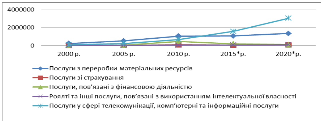
Рис. 1. Динаміка зовнішньої торгівлі основними послугами за видами з 2000 року – експорт, тис. дол. США (згруповано авторами на підставі [10])

Процеси глобалізації і цифровізації суспільства призводять до зростання такого сегменту міжнародної торгівлі як торгівля продукцією інтелектуальної власності, тобто продукцією яка є результатом розумової діяльності.