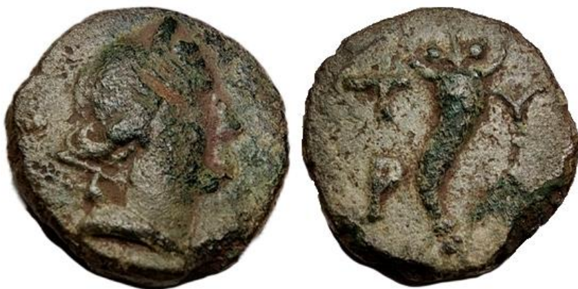
Рис.1 (без масштабу)

Розвиток в останні десятиліття приладового металопошуку та його застосування так званими «пошуковцями» або «скарбошукачами» при недостатній правовій захищеності археологічних пам'яток призводить до їхньої руйнації та «збільшення кількості археологічного матеріалу на колекційному «чорному» ринку» (Коцур, 2016). Проте учені без спеціальної державної підтримки самостійно не в змозі вплинути на таке негативне явище, як несанкціоновані аматорські розкопки за допомогою спеціальних приладів металопошуку. Охорона археологічних об'єктів не в компетенції нумізматів, проте наукова фіксація всього доступного матеріалу є професійним обов'язком нумізматів. Однією з цікавих знахідок з території Дніпровського Правобережного Лісостепу є мідна монета античного міста Тіра (Рис. 1), знайдена 2021 року в Черкаському районі Черкаської області