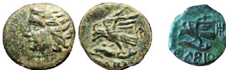
Рис. 1. Монети «обольної серії» з різновидами монограми Ⲛ .

До того ж слід зазначити, що монограма, аналогічна диференту № 17, є присутньою на одному з номіналів так званої «обольної серії», ймовірно, діхалків (див. каталоги В. Анохіна (Анохин, 2011: №№ 265, 266), В. Нечитайла (Нечитайло, 2000: №№ 207, 208), Є. Колесніченка (Колесніченко 2021 №№ ба, бб, бв)). В. Анохіним ці монети датуються 330–325 рр. до Р. Х. (рис. 1). Таке датування ми надійно підтвердили іншими монограмами цієї серії. Так монограма Ⲙ (Анохин, 2011: № 267; Нечитайло 2000: № 210) ототожнюється із відомою історичною особою – епонімом 327 р. до Р. Х. на ім'я Εὐρήμων Τυρσιθέου; монограма Ⲛ (Анохин 2011: № 273; Нечитайло 2000: № 216) ототожнюється з епонімом 325 р. до Р. Х. на ім'я Διστέφης Ἐστιάίου. Зазначимо, що в каталозі Є. Колесніченка наведено графічний варіант монограми Ⲛ (горішня частина трикутника має вертикальну гасту (Колесніченко 2021 №№ ба, бб, бв)). (рис. 1, справа).