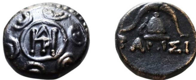
Рис. 2. Монета Деметрія з монограмою.

Для подальшого тлумачення монограми Α скористаємося загальноантичним досвідом. Так, аналогічну монограму утримують бронзові монети Деметрія I Поліоркета (Δημήτριος ὁ Πολιορκητής), полководця та македонського царя (306–283 рр. до Р. Х.), карбовані у Пеллі ( https://www.cngcoins.com/Lot.aspx?LOT_ID=70057 ). Монограма (рис. 2) однозначно інтерпретується ім'ям Деметрій. Втім слід зазначити, що на відміну від диферента № 17 монограма Деметрія I Поліоркета утримує у нижній частині вертикальну гасту, до якої додано півколо літери ρο . Така деталізація пов'язана зі збільшенням абсолютного розміру монограми на монеті Деметрія на відміну від «обольної серії».