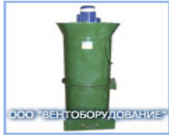
Агрегат ЗИЛ-900 для отсоса абразивно-металлической пыли