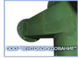
Всасывающий патрубок агрегата ЗИЛ-900