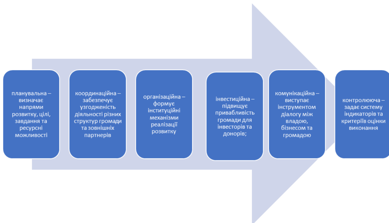
Рисунок 1.1 – Ключові функції стратегії

Стратегія розвитку територіальної громади виступає фундаментальним документом стратегічного планування, який визначає довгострокові орієнтири місцевого розвитку та механізми їх досягнення. У теоретичному контексті її сутність полягає у поєднанні концепції сталого розвитку, принципів раціонального ресурсного менеджменту та інструментів публічного управління. Таким чином, стратегія є не лише описом майбутнього, а й практичним планом дій, який забезпечує безперервність управлінських процесів та узгодженість рішень.