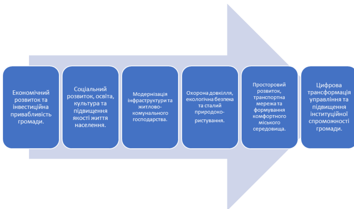
Рисунок 2.2 – Ключові напрямки Проєкту Стратегії розвитку Кропивницької міської територіальної громади на період до 2030 року

Чинна практика стратегічного планування розвитку Кропивницької міської територіальної громади демонструє системний підхід до формування довгострокових пріоритетів і управлінських рішень. Основним документом, який визначає напрям розвитку громади, є Проєкт Стратегії розвитку Кропивницької міської територіальної громади на період до 2030 року. Саме ця Стратегія виступає ключовим інструментом прогнозування майбутніх змін, формування бажаного образу громади та забезпечення узгодженості управлінських дій у середньо- та довгостроковій перспективі.