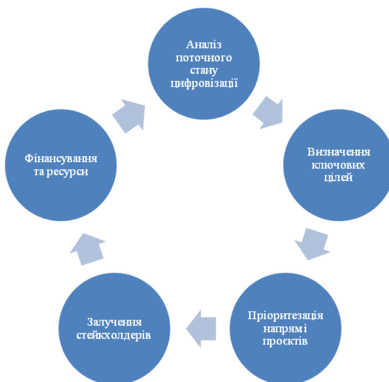
Рисунок 3.1 – Модель стратегічного цифрового розвитку територіальної громади

Цифрова трансформація публічних послуг спрямована на підвищення прозорості, доступності та ефективності управління громадою. Це включає впровадження електронних реєстрів, систем моніторингу, аналітичних платформ для прийняття рішень, автоматизацію бюджетних процесів та звітності.