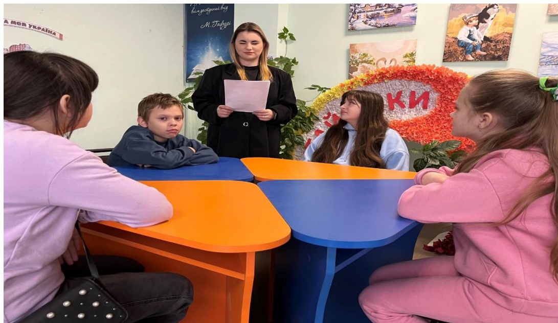
Рис.3.1.Фото із заходу «Година толерантності» бібліотеки-філії №21

У світі, де люди щодня стикаються з величезною кількістю інформації, важливо вміти відрізнити достовірні джерела від недостовірних. Бібліотеки організовують тренінги з медіаграмотності, навчають користувачів працювати з електронними ресурсами, користуватися цифровими сервісами та розвивати критичне мислення. Бібліотека виступає простором комунікації та соціальної взаємодії.