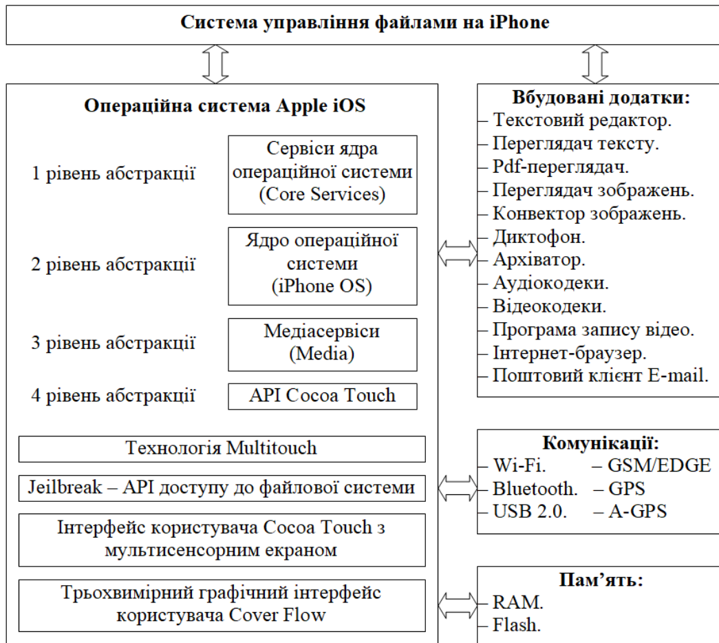
Рисунок 1 – Структурна схема системи

Технологія iPhone представлена у вигляді шарів. Основний шар – це Core OS. На його вершині перебуває шар Core Services. На вершині шару Core Services перебуває шар Media. І на самій вершині перебуває шар Cocoa Touch. Взагалі можна ще більше спростити цю технологію. Можна розділити й об'єднати їх в 2 шари – це шар мови C і шар Cocoa мови Objective C (рисунок 2).