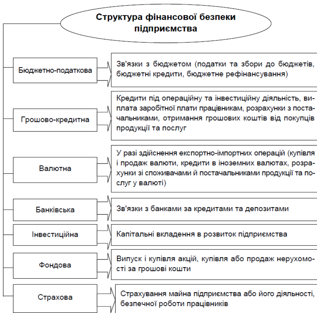
Рисунок 1 - Структурні елементи фінансової безпеки підприємства [2].

Фінансова безпека підприємства є важливою складовою частиною економічної безпеки. Її головною метою є забезпечення стабільного та максимально ефективного функціонування підприємства в сучасних умовах, а також у створенні високого потенціалу для його розвитку в перспективі. Структурні елементи фінансової безпеки підприємства взаємопов'язані і значною мірою залежать від впливу зовнішніх та внутрішніх факторів, а також повинні сприяти підвищенню рівня фінансової безпеки та ефективно протистояти різноманітним загрозам (рис. 1).