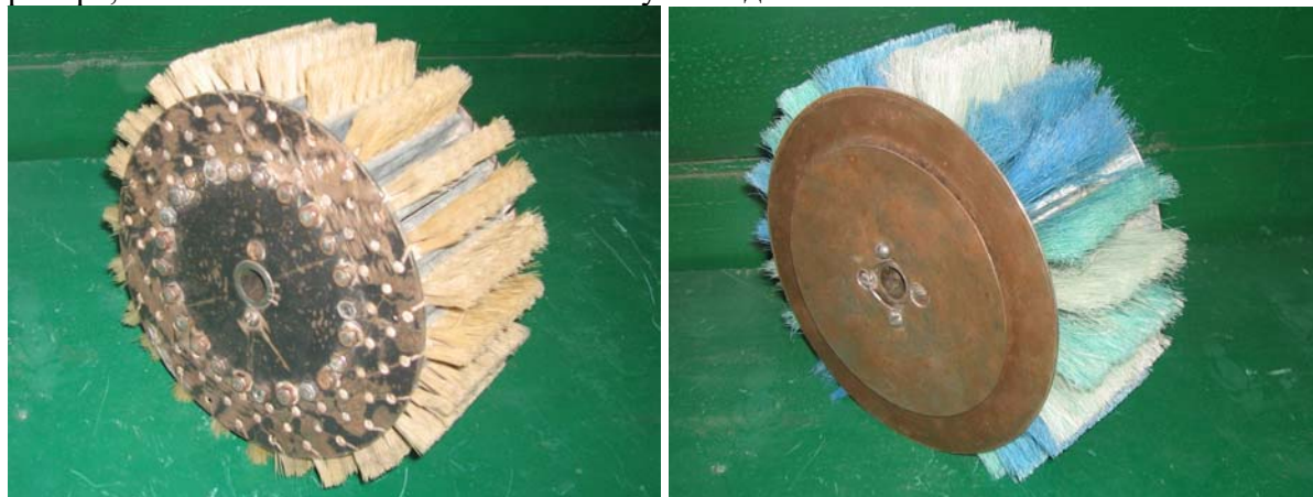
Рисунок 2 – Загальний вигляд дослідних роторів

На підставі вказаного вище зазначимо, що актуальною задачею є визначення характеристик повітряного потоку у пневмоканалі в залежності від частоти обертання ротора, а також кількості лопаток на ньому та їх довжини.