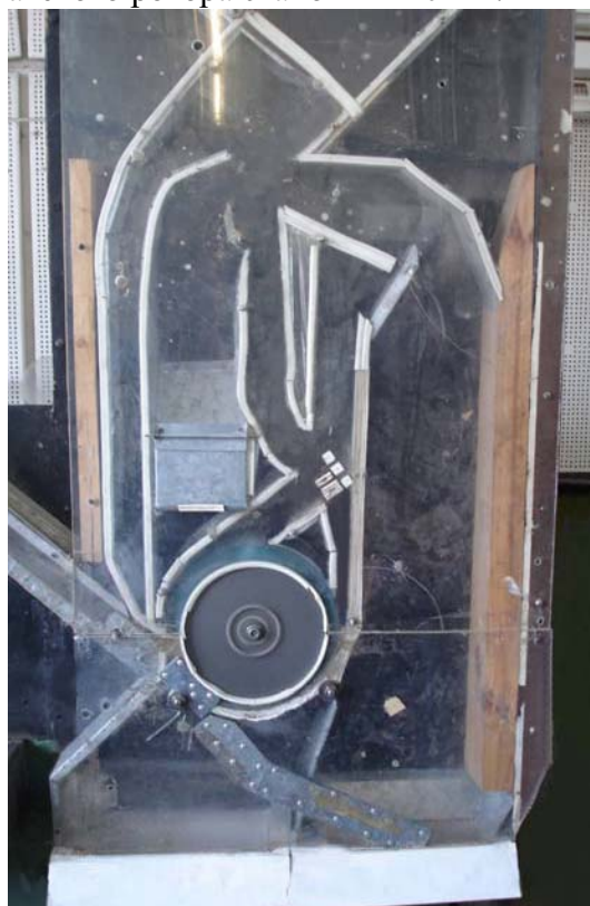
Рисунок 3 – Загальний вигляд лабораторної установки

Дану серію дослідів проводили на лабораторній установці (рис. 3) в режимі холостого ходу, без подачі зернового матеріалу. Ширина каналу становила 100 мм, висота – 50 мм. Діаметр лопатевого ротора становив 240 мм.