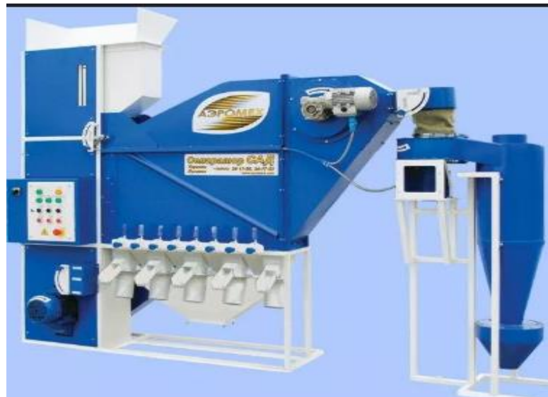
Рисунок 4.2 Сепаратор аеродинамічний (САД-5)

Недоліки: потребує надзвичайно точного налаштування та значних витрат електроенергії при очищенні сильно забруднених мас.