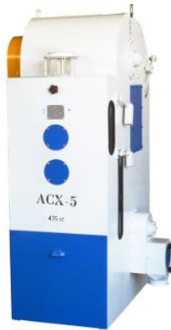
Рис 4.1 Сепаратор АСХ-5

Принцип роботи сепаратора схожий із принципом роботи АСХ-2.5.