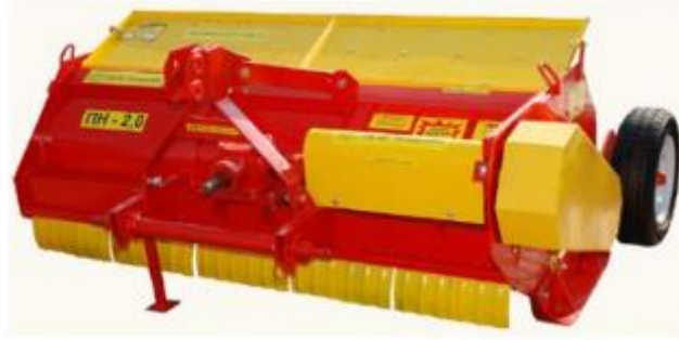
Рисунок 2.3 Подрібнювач типу ПН-2,0

Однією з ключових задач під час підготовки ґрунту для сої є його максимальне звільнення від бур'янів, зокрема від тих, що розмножуються кореневищами (пирій) та кореневими паростками (осот рожевий, березка польова). Якщо ці бур'яни присутні, лущення ґрунту рекомендовано виконувати у два проходи, на глибину від 10 до 16 см. В умовах мінімального обробітку ґрунту повторне лущення може бути базовим заходом з подальшим передпосівним обробітком навесні.