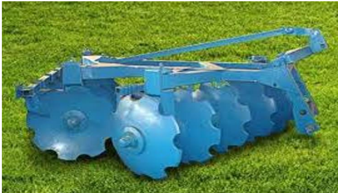
Рисунок 2.4 Дискова борона БДН-3,0

1. Луцнення стерні (відразу по збиранню врожаю, глибина - 6-10 см; знаряддя для обробітку: дискові луцильники ЛДГ-10, ЛДГ-15 або дискові борони БДН-3,0)