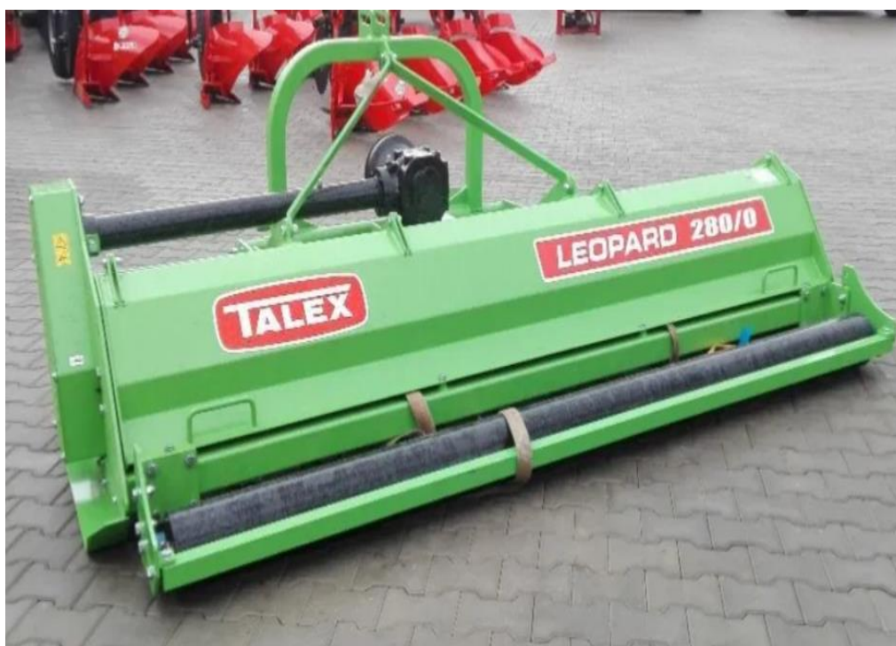
Рисунок 2.2 Подрібнювач Leopard 280

Соя у сівозміні зазвичай займає місце після стернових культур та кукурудзи, при цьому її частка не повинна перевищувати 15-20% загальної площі сівозміни. Специфіка технології основного обробітку ґрунту значною мірою залежить від попередників та кількості післяжнивних рослинних решток. Зокрема, після кукурудзи, а також у випадках наявності валків зернових та великої кількості соломи, перед початком обробки ґрунту необхідне подрібнення рослинних решток за допомогою подрібнювачів типу Leopard, ПН-2,0 з подальшим якісним дискуванням ґрунту.