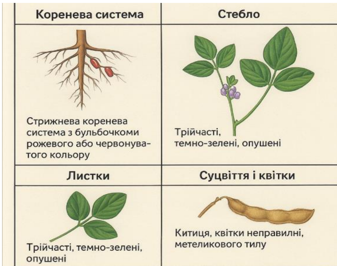
Рис 2.1 Морфологічні ознаки рослини сої