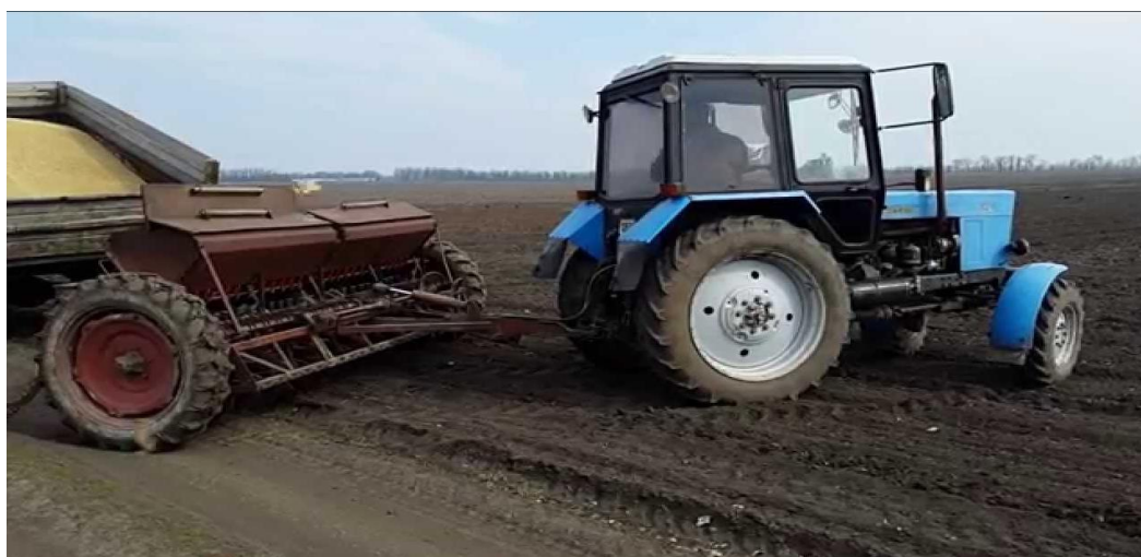
Рисунок 2.6 сівалка СЗ-3,6 в агрегаті з трактором МТЗ-82

Сою сіють звичайним рядковим або широкорядним способом з шириною міжрядь 15-45 см або 45-70 см. Норма висіву сої при дотриманні рядкового способу сівби має бути 80-120 кг/га (600-800 тис. насінин/га). Сіяти сою потрібно на глибині близько 3-5 см. В господарстві використовується сівалка СЗ-3,6 в агрегаті з трактором МТЗ-82 [7].