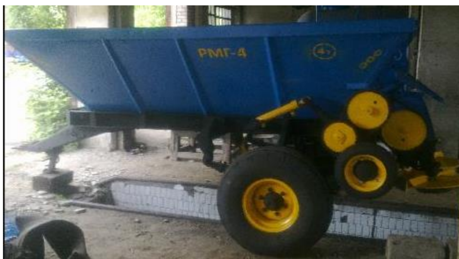
Рисунок 2.5 Розкидач мінеральних добрив РМГ-4

Для внесення добрив у ґрунт доцільно використовувати комплексні розкидачі добрив типу РМГ-4, МВУ-5, у агрегаті з тракторами МТЗ-82 або ЮМЗ-6. Рідкі добрива або мікроелементи можливо вносити через обприскувачі ОПШ-2000, ОП-200 та інші.