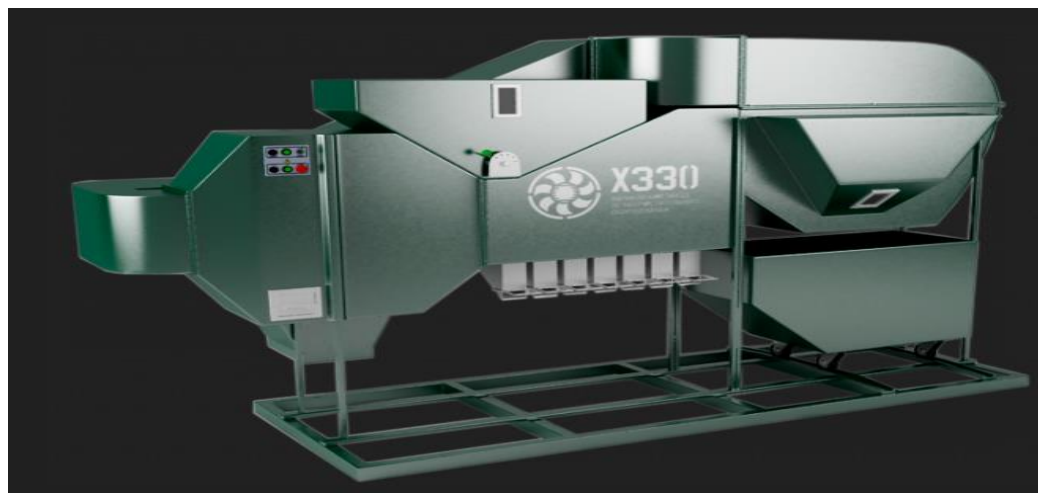
Рисунок 4.3 Аеродинамічний зерновий сепаратор ІСМ-5

Недоліки: складна система регулювання, вища вартість у порівнянні з вітчизняними аналогами.