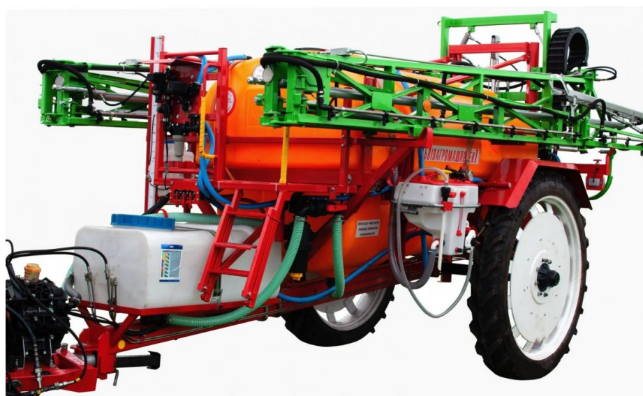
Рисунок 2.6 Обприскувач ОПШ-2000